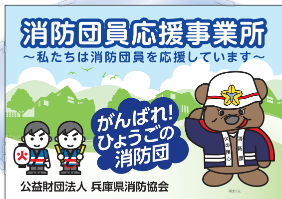
▲消防団員応援事業所ステッカー

地域の飲食店、物品販売店や事業所などに『消防団員応援事業』として登録いただき、地域で活躍する消防団員に特典やサービスを提供いただくことで、地域全体で消防団活動を盛り上げ、地域の活性化につなげることが目的です。