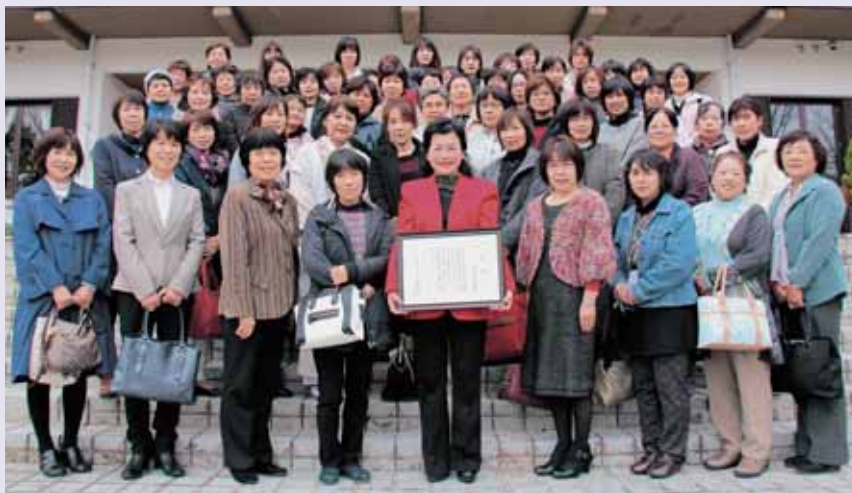
▲研修会での集合写真(12月6日)