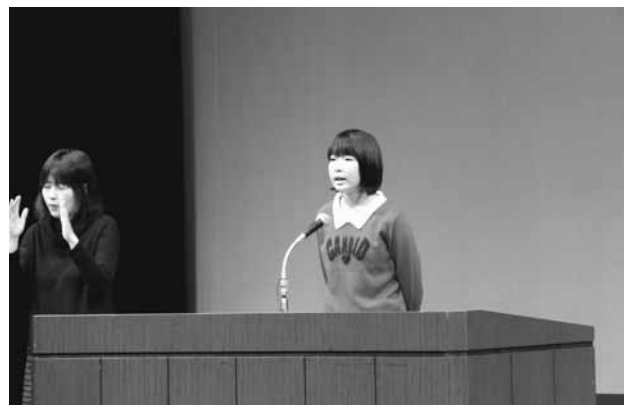
▲人権についての思いを発表