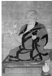
こんごうち ▲金剛智像図

真言密教が、インドから中国を経て日本の弘法大師に伝わるまでの八人の祖師を描いたもので、現在は当初の弘法大師像は失われており、七祖の図像が残されています。いずれも習熟した室町水墨画の技法で描かれており、中世期にさかのぼる祖師像としては、町内で最も古い作例となります。なお、明和元年(1764年)に修理された記録の墨書が残されています。