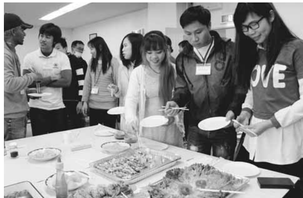
▲各国の料理に舌鼓

同教室は、支援者20人が毎週アスパルで開いている日本語教室で、ベトナムや韓国、中国、台湾、フィリピン、カナダ、インドネシア出身の多可町在住の外国人23人が学んでいます。今回の交流会は、教室生や町内の外国人など100人がフリートークをしたり、落語やクイズ、歌などを楽しみました。