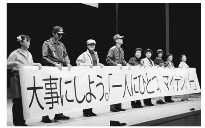
▲マイナンバー詐欺防止を呼び掛け