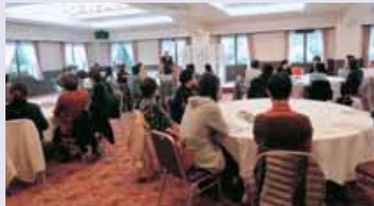
▲講演に聞き入ります(12月6日)