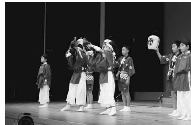
▲「鶏合わせ」を基にした創作舞を披露(中南小6年生)

歌舞伎や和太鼓、落語やダンスなど町内で芸能活動を行う園児から中学生までの14団体約260人が一同に会する子ども芸能祭。かわいらしいダンスや力強い太鼓の音色、大人顔負けの迫真の演技に客席からは大きな拍手が送られました。