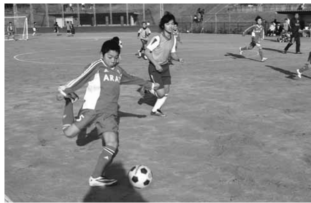
▲白熱した試合が展開されました