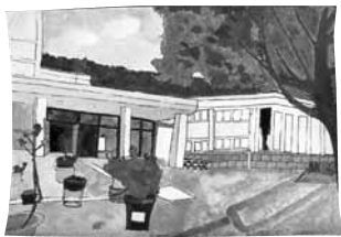
『思い出いっぱいの校舎』