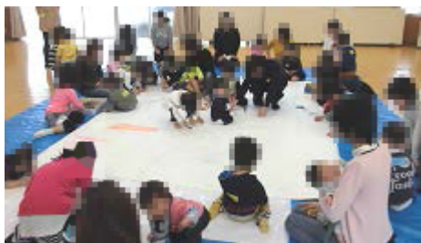
みんなで大きな紙にお絵描き☆