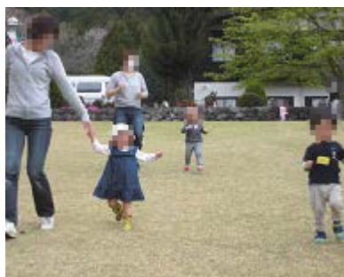
芝生の上は気持ちいい～☆