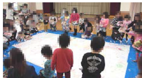
紙の上に花を咲かせたよ～♪♪