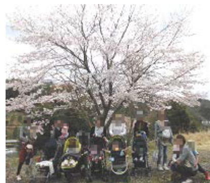
桜の木の下で☆写真撮影～