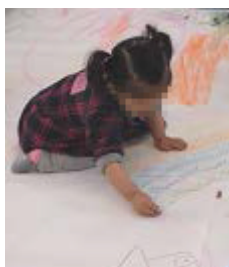
楽しい～♪花びらもチョコキチョコキ