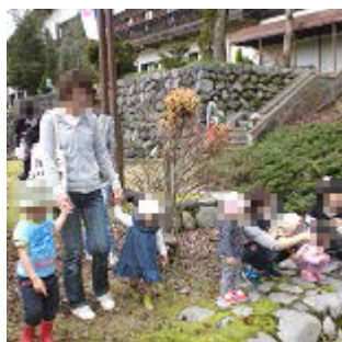
周辺散歩もしたよ☆