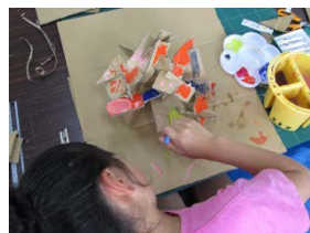
ずこう「ビルダーカード」