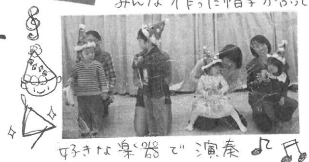
好きな楽器で演奏

少し肌寒からたけど"元気 いっぱい、外への葉っぱはひろい に出かけました。 落ちていた葉木の実、お友達 がもっているものにも興味を もちたのいていました。 エトは、いサミヤノリ にとても興味を示して いました。