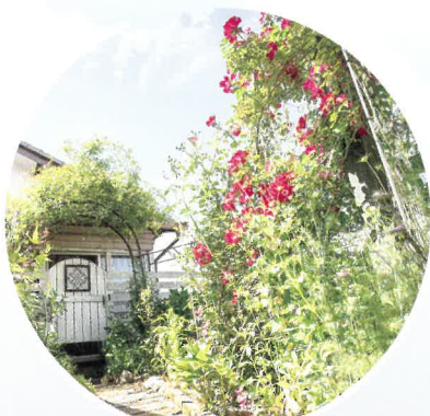
一般宅のお庭公開 オープンガーデン