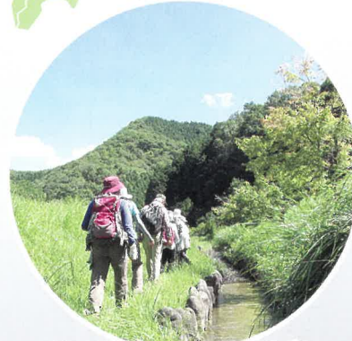
歩いて健康 ヘルスツーリズム