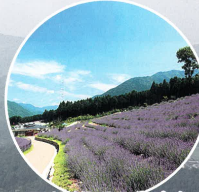
西日本最大級のラベンダーパーク