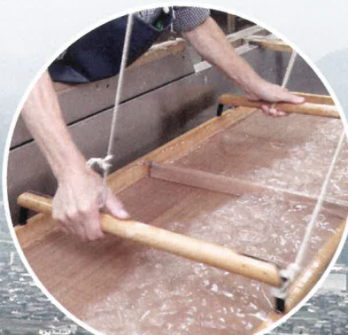
伝統の手漉き和紙 杉原紙