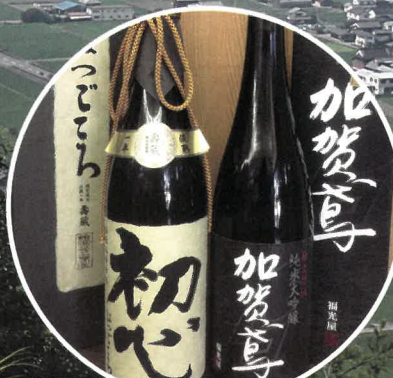
日本一の酒米「山田錦」発祥のまち