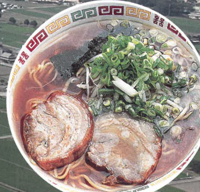
甘口のあっさり味 播州ラーメン