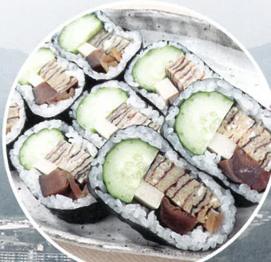
郷土の味 巻き寿司