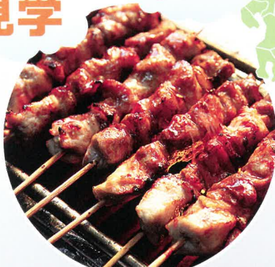
歯ごたえ抜群 播州百日どり