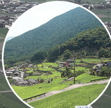
日本の棚田100選選定 いさりがみ 岩座神の棚田