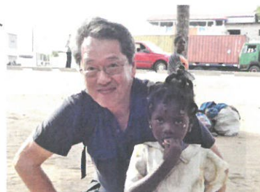
トコゴの 子どもと いっしょに