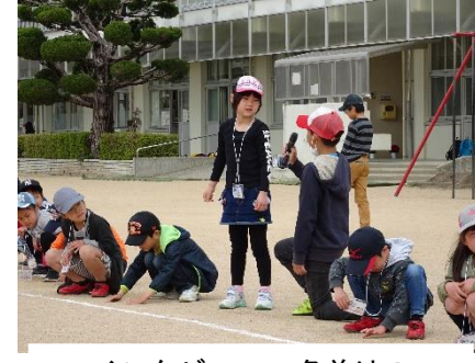
インタビュー。名前は？