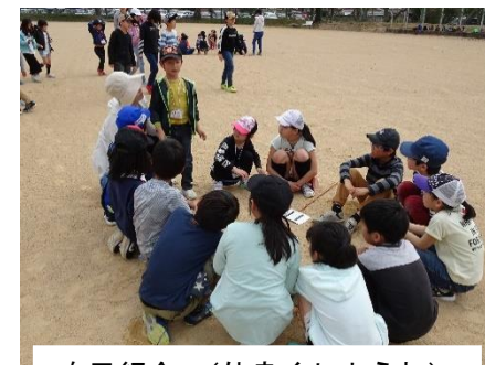
自己紹介。(仲良くしようね)