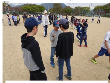
班対抗のゲーム。「がんばれ！」