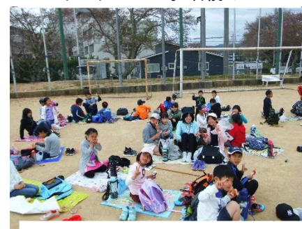
みんなでお弁当。最高！