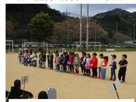
1年生からお礼。ありがとう！