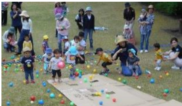
斜面を使ってボール転がし！たくさんのボールに大はしゃぎの子ども達でした！