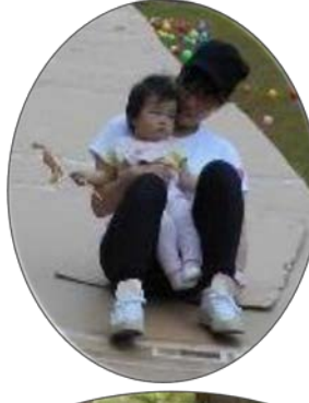
段ボールの滑り台もサイコー☆