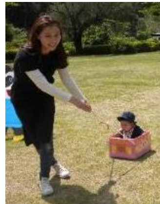
段ボールのソリで、子ども達は大喜び！