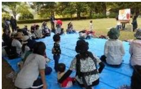
大勢の親子が参加されました！

『芝生であそぼう』をテーマに、多可西脇の親子が集まり、芝生や風の気持ちよさを感じながら、のびのびと遊びました。親子の時間、親子同士の交流を楽しむことができました。