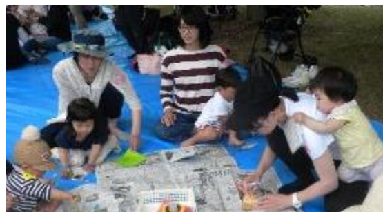
風車を作って遊びました！風にクルクル回って楽しかったね。