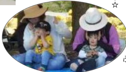
ふれあい遊びで お母さんとスキンシップ♡