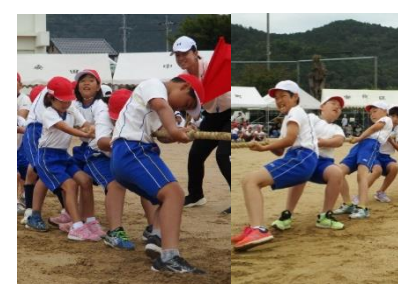
【楓っ子ちゃん杯綱引き】