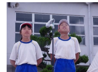
【副児童長 終わりのことば】