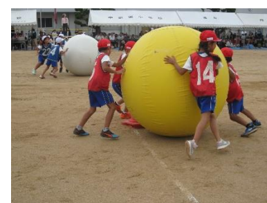
【大玉ごころごころ】