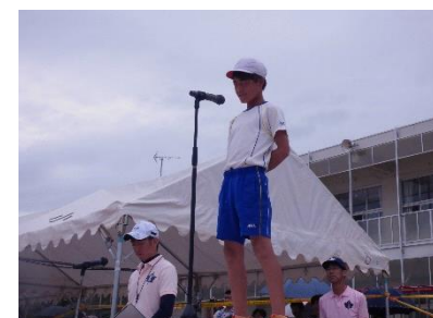
【児童長 誓いのことば】