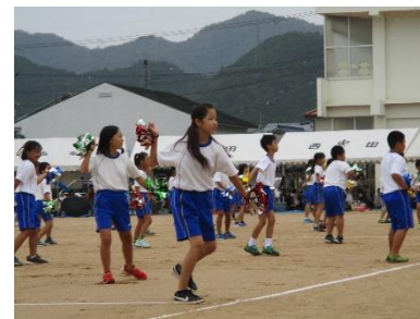
【Smile For it!】