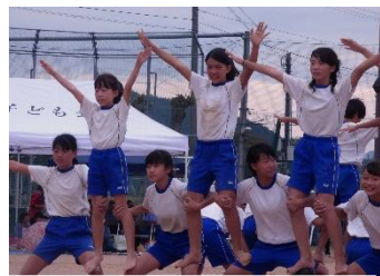
5, 6年の組体操に感動

9月21日実施予定の運動会を、1日順延して22日(日)に行いました。保護者の皆様には、順延の連絡にご対応いただきありがとうございました。