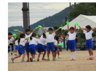
【へんしんマスカット】