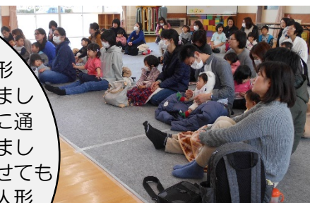
大勢の参加者でにぎわいました!

加西市を中心に活躍されている“mama ねひめ”の皆さんにお越しいただき、人形劇やトーンチャイム演奏を楽しみました。日曜日の開催ということで、園に通っている子ども達の参加が多くありました。トーンチャイムの演奏体験をさせてもらい、楽しく真剣に演奏する姿や、人形劇に大笑いする姿が印象的でした。親子で、音楽やおはなしを楽しめるすてきな時間でした。