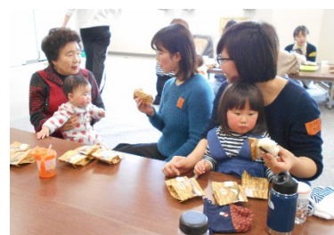
お昼ごはんも一緒にいただきました