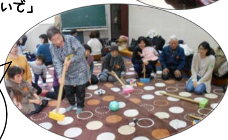
ゴルフゲームで交流