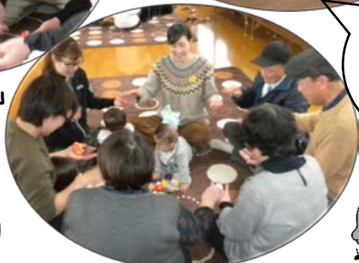
お手玉あそびで交流