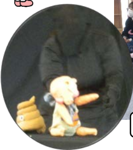
うんちが登場し、会場は大爆笑!!