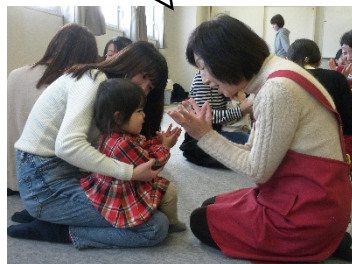
手遊びしましょう！