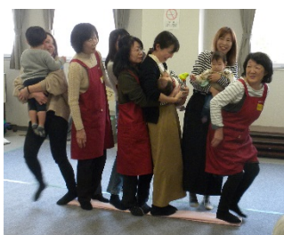
みんなで楽しいゲーム