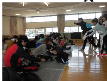
手遊び「コンコンクシャンのうた」