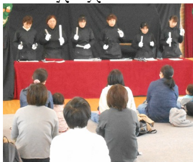
トーンチャイム演奏にうっとり