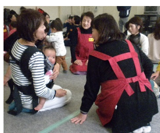
会話も弾みました！