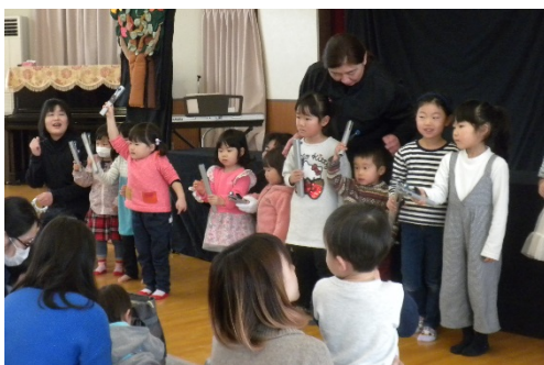
子ども達もトーンチャイムに挑戦!