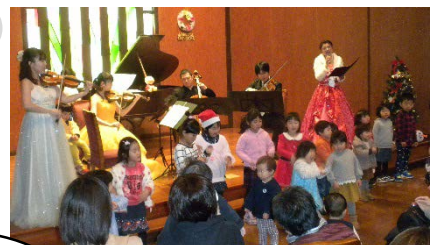
クリスマス親子コンサート