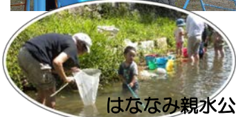
はななみ親水公園