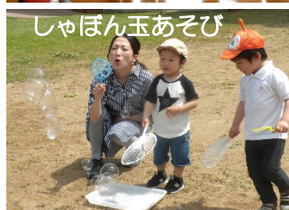
しゃぼん玉あそび