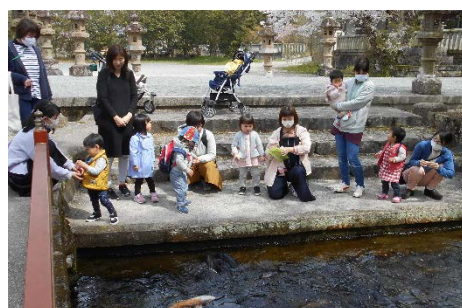
大きな鯉がいっぱい！