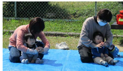
親子で楽しむ手遊び♪