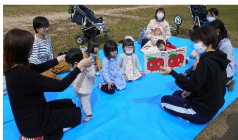
朝のつどいで手遊びと絵本を楽しみます