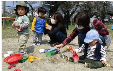
みんなでお砂あそび♪