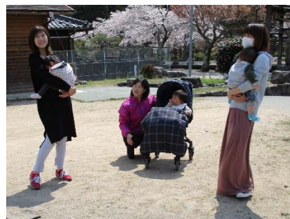
お母さん同士で情報交換