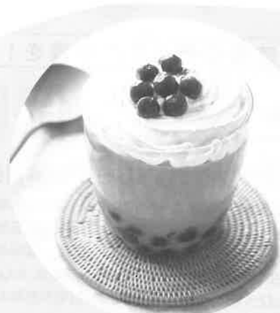
タピオカミルクティゼリー