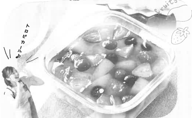
フルーツたっぷりスコップゼリー