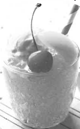
メロンクリームソーダゼリー