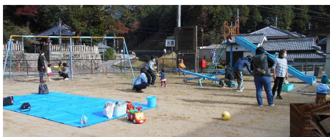
八千代区大屋の児童公園

ブランコやすべり台、砂場、シーソーがあり、十分に楽しめますよ！とっても広い運動場もあります！遊びに行ってみてね♪