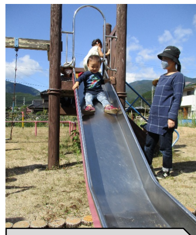
加美区熊野部の児童公園