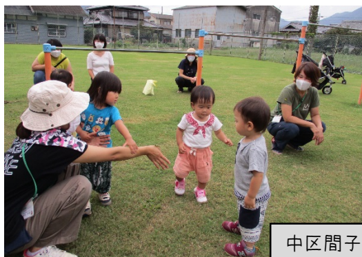
中区間子の児童公園

多可町内の各地区には、小さな子どもたちが遊べる公園があります。センターでは、遊び場の紹介も兼ねて、出張ひろばをしています。