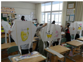
1年生 たこを作ったよ！