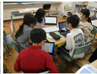
4年生 理科の授業で話し合い