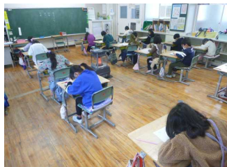
2年生 漢字テストに挑戦中