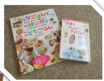
育児書や料理の本