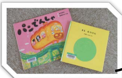
0歳から楽しめる絵本