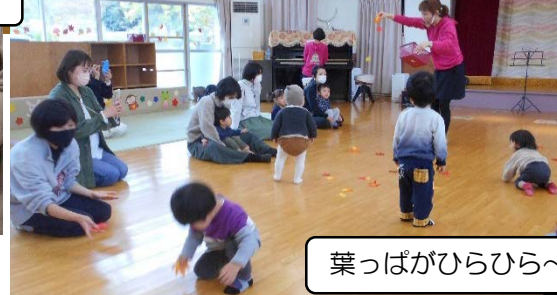
葉っぱがひらひら～