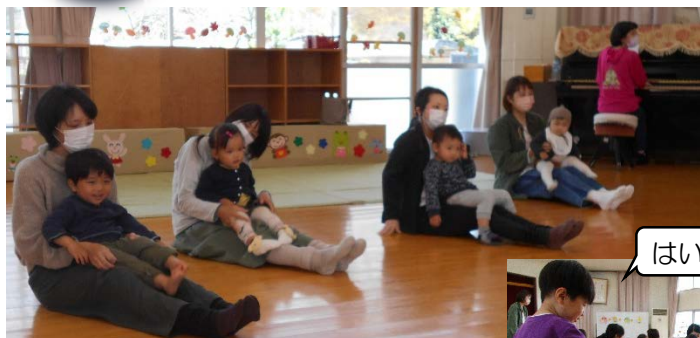
お母さんのひざの上でぎげんさん

音楽に合わせて 親子でスキンシップ 遊びをしたり、季節 の歌を聴いたりしま したよ。