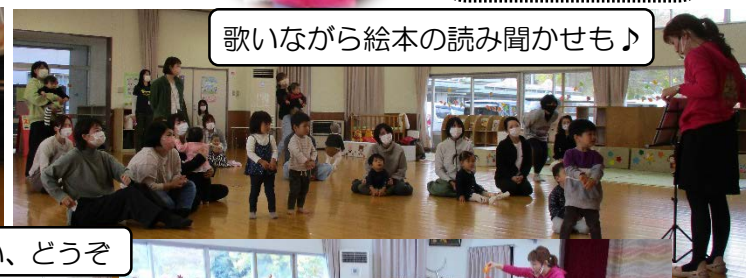
歌いながら絵本の読み聞かせも♪