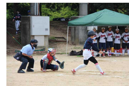
ソフトボール：明石海浜公園