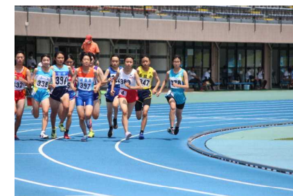
陸上：明石総合競技場