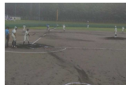
野球：アラジンスタジアム