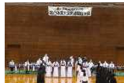
剣道：高砂市総合体育館