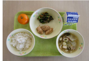
12月5日（月）の給食 2年2組2班考案の献立