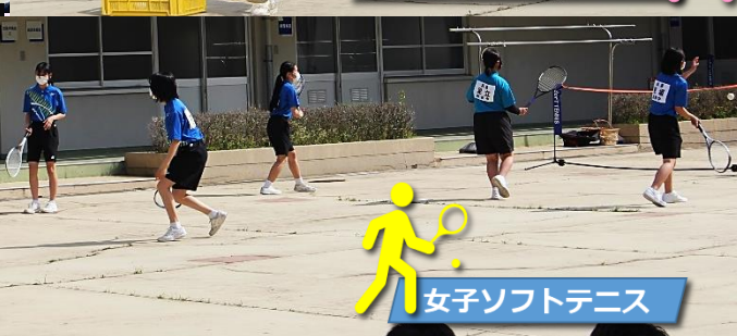
女子ソフトテニス