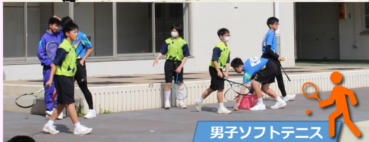
男子ソフトテニス