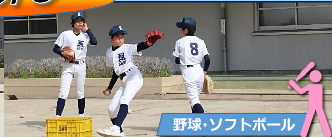
野球・ソフトボール