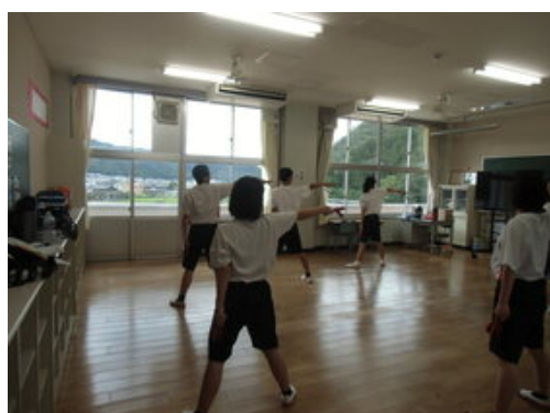
夏休み八中ソーランリーダー研修の様子

いよいよ2学期が始まりました。みなさんは、夏休みの24時間×42日＝1008時間をどのように過ごしたでしょうか。きっと、進路決定に向けて勉強を頑張った人や部活動やクラブチームでの活動を頑張った人など、自分の目標に向かって充実した夏休みを過ごした人が多かったことでしょう。