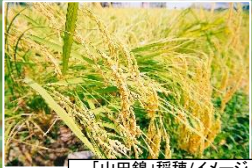
「山田錦」稲穂/イメージ

兵庫県の真ん中あたりに位置し、自然豊かな地域で、ゆっくり過ごしていただける町です。自然は豊かでも、買い物に困るほど田舎でもなく、神戸・大阪などの都心部へも一時間ちょっとで行ける場所にあるため、自然と利便性のバランスが優れています。近年、ゆっくり過ごしたい方や子育ての環境を重視する方達が、移住先として多可町を選んでいただいています。