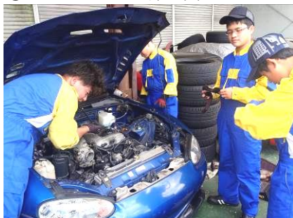
⑧ ドッグファイト プロ