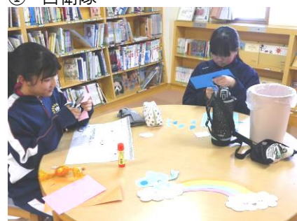
④ 中・みなみ児童館