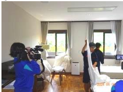
⑬ エーデルささゆり