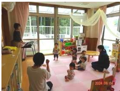
⑪ ちびっこランド らくえん