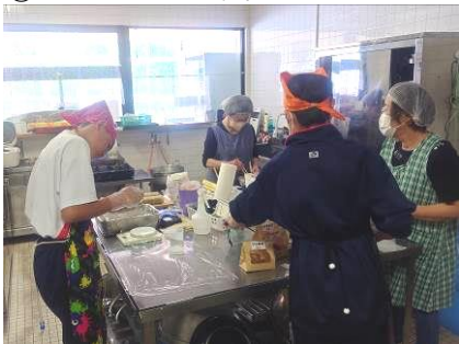
⑮ エアレーベン八千代