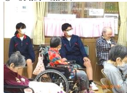
⑨ 社会福祉法人楽久園会