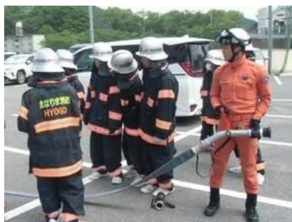
② 北はりま消防組合西脇消防署