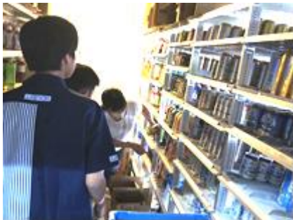
⑯ ローソン多可町八千代店