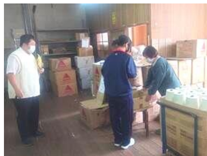
⑫ 播磨染工株式会社