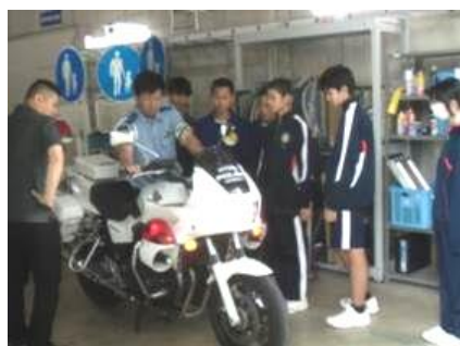
③ 兵庫県西脇警察署