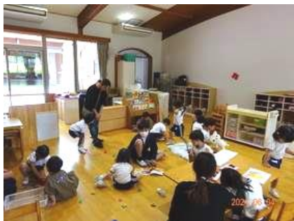
⑩ キッズランドやちよ