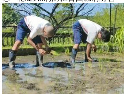
⑤ なか・やちよの森公園