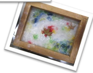
なつチャレ2023 紙すき体験作品