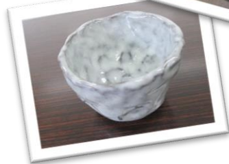
なつチャレ2023 陶芸体験作品