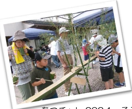
なつチャレ 2024 そうめん流し