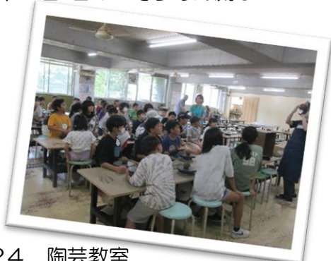
なつチャレ 2024 陶芸教室