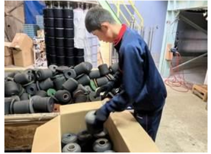
⑫ 播磨染工株式会社