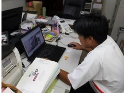
⑭ エアレーベン八千代