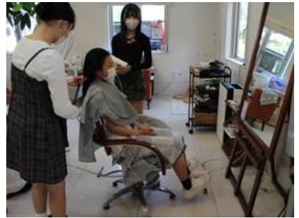
⑱ ヘアサロン Green Pease