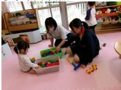
⑦ ちびっこランドらくえん