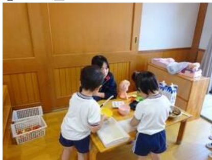
⑧ キッズランドやちよ