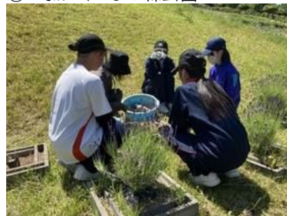
⑥ ラベンダーパーク多可