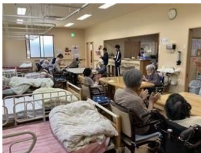
② NPO法人 宅老所ろまん