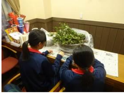
⑬ エーデルささゆり