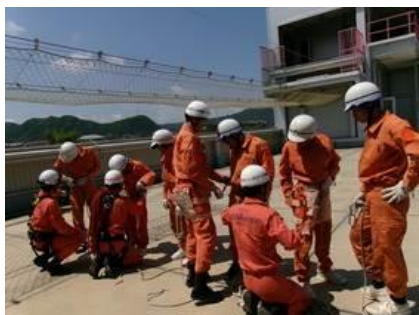
① 北はりま消防組合西脇消防署

6月2日(月)～6日(金)(※一部土日の活動あり)の日程で、2年生がトライやる・ウィークに臨みました。トライやる・ウィークは、兵庫県教育委員会が子どもたちの「心の教育」と地域のつながりづくりの一環として平成10年度から全国に先駆けて実施している体験教育です。保護者の皆さまの中にもトライやる・ウィークを経験された方がおられるのではないのでしょうか。今年度は町内外18の事業所に受け入れていただき、学校の教室ではできない貴重な体験から、仕事の大切さや厳しさ、大人の人の優しさなど身をもって体感することができたようです。トライやる・ウィークを終えてのアンケートでは「 1週間は充実していた(84%) 」「 家庭での会話が増えた(71%) 」という項目が高い結果となりました。「 自分の進路や将来について考えるようになった(68%) 」の項目では、 昨年度の町全体の結果の+12ポイント となったことに嬉しく思いました。また、活動を通して感じたこととして「 働くことの大切さ、厳しさ、楽しさ(90%) 」「 大人の人の優しさ(84%) 」「 コミュニケーションの大切さ(82%) 」「 保護者や大人の人の感謝の気持ち(79%) 」が高い結果となり、 1週間の体験から大きな影響 を受けたことが見て取れます。1週間の貴重な体験をこれからの生活に活かしてくれることを期待しています。お世話になった事業所の皆さま、保護者の皆さま、地域の皆さま、本当にありがとうございました。引き続き、中学校の生徒たちの成長を支えていただきますようお願い申し上げます。