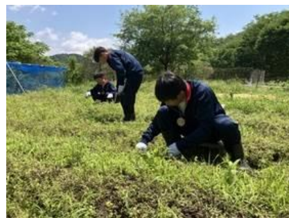
③ なか・やちよの森公園