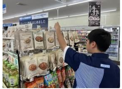
⑮ ローソン多可町八千代店