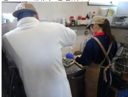
⑤ パン屋 coron