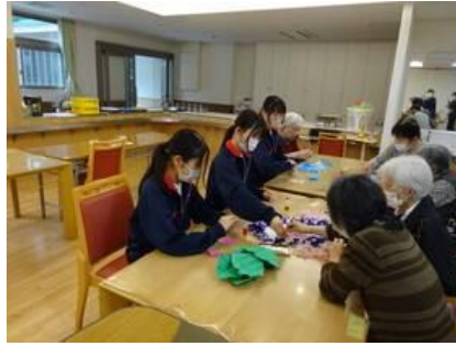
⑪ 社会福祉法人 楽久園会