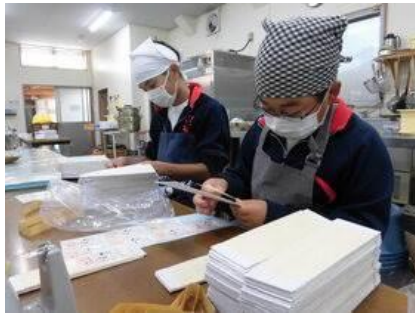
⑰ マイスター工房八千代