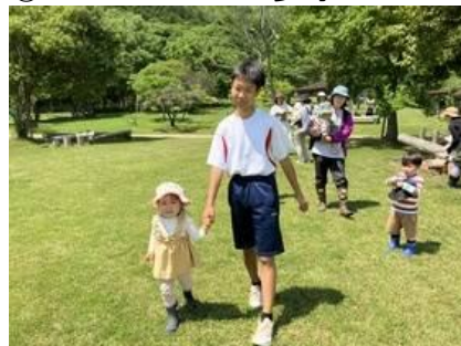
⑨ 森のようちえん ころね