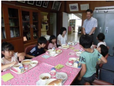
おたんじょうび給食

1学期の学校だよりで紹介しきれなかった様々な取り組みです。地域の方々にも本当にお世話になりました。保護者の皆様、地域の皆様のご支援があつてこそ、本校の教育活動が円滑に進んでいます。改めまして感謝申し上げます。