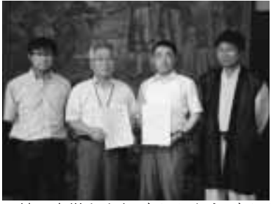
▲神戸大学とまちづくり・むらづくりに関する協力協定を締結