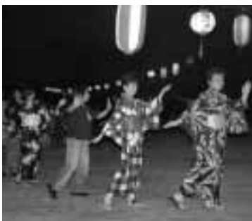
▲みんなで盆踊りを満喫

普段の生活の中で、そつと相手を思いやる。そんな何気ないやさしさの積み重ねが、いざというとき、きつと大きな力になる。