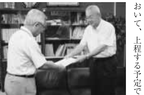
▲環境条例(答申)を町長に手渡す能瀬会長

月から5回にわたり「多可町の環境条例の策定」に関して審議を重ねてきました。また、今年7月には、町ホームページにおいて条例(案)を町民の皆さんに広く公表し、意見を募りました。その上で、多可町環境保全条例(案)を作成し、今回、町長に対して答申を行いました。