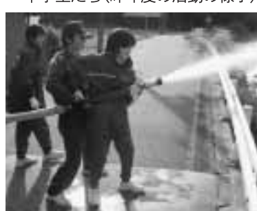
【写真】さまざまな活動で奮闘する中学生たち(昨年度の活動の様子)

中学生と消防団との交流を核として、地域での異世代間のつながりが一層深まるよう、地域の皆さんに活動を見守っていただき、交流の輪に加わっていただければと考えています。今年も、各区ごとに実施します。多くの皆さんのご協力をお願いします。