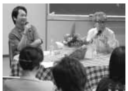
▲図書館の無限の可能性を語る

両氏は「言葉は声に出さないと伝わらない。耳から入る言葉は、聞き手の想像力を膨らませる。子どもたちには声に出して本を読んで欲しい」と語り、本の読み聞かせなど地域で子どもを育てることの重要性について言及しました。