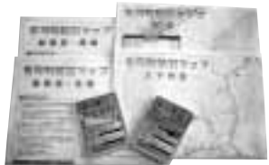
▲各戸に配布した防災ガイド・防災マップ

町内の避難所の所在地、緊急連絡先、情報の入手先、避難の心得など、いざというときに役立つ防災情報を掲載しています。災害に備えて事前に確認しておきましょう。