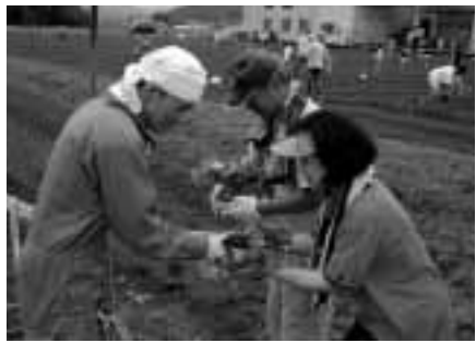
▲オーナーを通じて「北播黒豆の郷」を発信

「一生ここに住み続けたい」と思えるむらにしたい。横のつながりを大切にし、みんなが楽しく元気に暮らせるむらづくり。