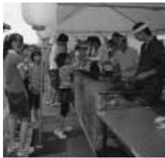
▲大人気の食べ物コーナー

「We are one(我々は一つ)」が合い言葉。「住んでみたい」、「住んでよかった」と思えるまちづくりをみんなで築いていきたい。