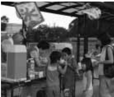
▲大人気の屋台コーナー

会場には、子どもからお年寄りまで大勢の人が集い、やぐらを囲んでみんなで盆踊りを楽しみました。また、よさこい踊りや花火大会、ビンゴゲームなどいろいろな催しを行い、楽しい夜を過ごしました。