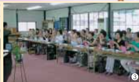
【写真】①バーバラ倶楽部の皆さん(第4回多可町音楽祭にて)／②③魔法(?)の鏡の前に、笑顔に包まれる練習の一コマ