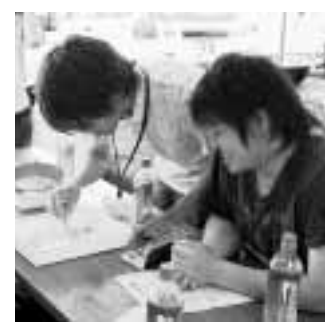
▲坂本集落で生物調査を実施

今回の協定に基づき、8月には、加美区の全世帯を対象にUターンやIターンに関するアンケート調査を実施しました。今後は、この結果を踏まえて、持続可能な地域づくりに取り組みます。