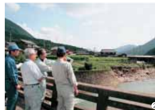
【写真】 ①/北播磨県民局への災害状況報告会(清水公会堂) ②/現地査察(杉原川・常磐橋(清水))