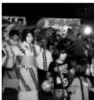
▶多くの人でにぎわう盆踊りの連