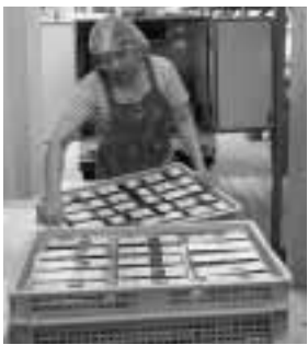
▲巻き寿司720本を佐用町へ

加美区地域協議会では、平成19年度から2年間にわたり、加美区内の全集落で現地調査を行い「平成20年度加美区みんなのまちづくり計画」を策定しました。