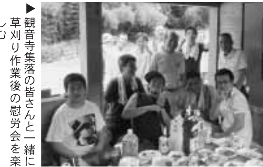
▲観音寺集落の皆さんと一緒に草刈り作業後の慰労会を楽しむ

7月からは、町の観光施設に限らず、いろいろなところで手伝いをさせてもらっています。活動を通して、たくさんの人と出会い、さまざまな経験ができて本当に楽しいです。こんな風に、短期間で多くの経験を重ね、より密接に地域について学べるのが協力隊の醍醐味です。