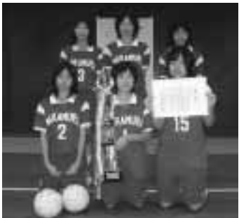
▲八千代区会場優勝 中村町