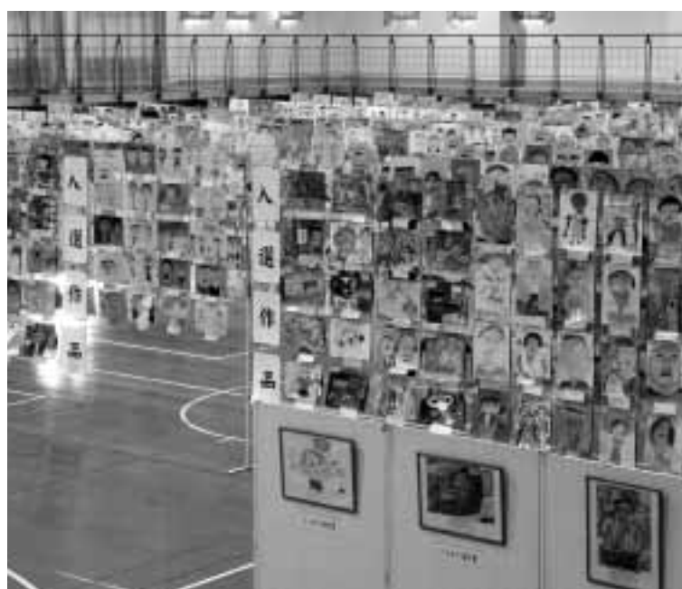
▲体育館いっぱいに展示された昨年の応募作品