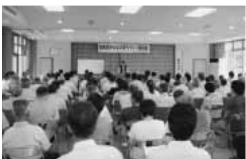
▲約130人が参加した加美区みんなのまちづくり講演会

参加者は、まちづくりにかかわる現状や課題、将来への展望について熱心に話を聞き、みんなで現況を確認し、情報を共有しました。