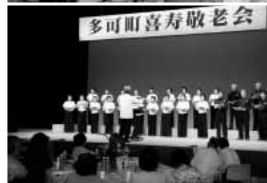
▲昨年の喜寿敬老会の風景