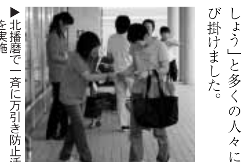
▲北播磨で一斉に万引き防止活動を実施

集まった6人の会員は「みんな考えよう!! 万引きは遊びじゃないよ犯罪だ」と書かれたチラシや万引き防止を啓発するティッシュなどを配りました。そして「万引きをすることは、社会のルール違反です。絶対に止めま