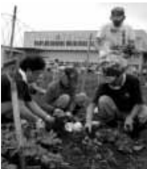
▲おいしいと評判の黒大豆

6月21日、地元オーナーと都市部のオーナー約130組が参加し、苗の定植が行われました。また、10月には、村人全員が参加して収穫祭を行います。郷土料理に舌鼓を打ちながら、都市部のオーナーと一緒に収穫を祝うこのお祭りは、みんなが心待ちにしている楽しいイベントです。