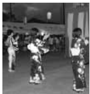
▲交流の輪を広げる夏祭り

会場には、浴衣姿の住民が多く集まり、みんなで準備した焼きそばやおでんなどに舌鼓を打ちました。また、やぐらを囲んで盆踊りを踊り、にぎやかで楽しいイベントを満喫しました。