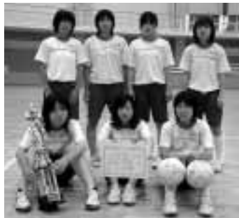
▲中区会場優勝 八千代区3部