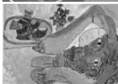
▲昨年度町長賞受賞作品