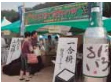
【写真】多可町の発祥自慢をPR 左/杉原紙 上/山田錦