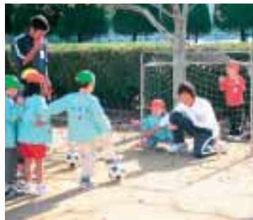
▲みんなで元気にサッカーを楽しむ