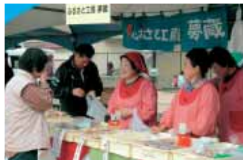
▲笑顔で特産品を販売・PR

11月3日、ガルテン八千代グラウンドで第3回ふるさと産業展を開催しました。今年「秋の1日を楽しむ」、「エゴを考える」をテーマに、町内産業のPRやふるさとの味を楽しむ特産品販売など田舎のにぎわいを演出しました。また、第2回都市と農村との交流やちよまつりもあわせて開催され、家族連れなど約16,000人が訪れ、深まりゆく秋の1日を楽しみました。