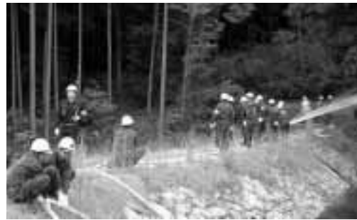
▲消防署・西脇消防団・多可町消防団による合同訓練

11月9日、15日の秋季全国火災予防運動に合わせて、11月9日に町内で消防訓練が実施されました。