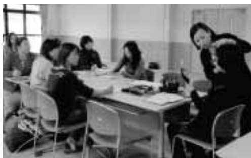
▲自然な美しさを引き出すメイク方法を学ぶ

先生は「就職の面接では、普段の表情が表に出ます。いつも凛とした美しい姿勢と口角を上げた笑顔を心掛けます。そして、個々が持つ自然な美しさを生かしたメイクで好印象を与えましょう」とイキイキメイクの方法を実演しながらアドバイスしました。