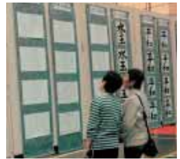
▲たくさんの方の書道・作品を展示

ガルテン八千代体育館では、多可町文化祭に合わせ、税に関する習字や平和ポスターなどの展示が行われ、多くの来場者が訪れました。