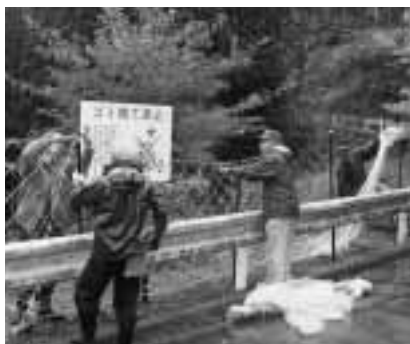
▶不法投棄防止ネットを設置する集落の皆さん

地域を潤す源流の里。 清らかな水と緑豊かな自然環境を守りたい。 住民みんな環境美化に取り組んでいます。