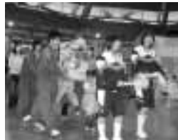
▲さわやかな中・高生ボランティアさん。また来てね