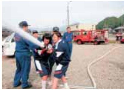
▲初めての放水訓練に挑戦

町では、地元消防団の協力のもと、地域の中学生と消防団員との交流に取り組んでいます。今年度は、11月2日から1月17日までの2カ月半にわたって、各集落ごとに実施しています。（加美区は12月7日に「斉実施」実施初日の11月2日、森本集落では中学生18人が参加し、消防団員と共に集落全戸への火災予防啓発のビラ配りや実際の消防ポンプを使った放水訓練などを行いました。また、西安田集