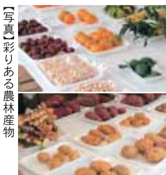
【写真】彩りある農林産物

ふるさとのにぎわいは、多くの皆さんの笑顔と安全・安心の信頼があつてこそ生まれるものです。地域の女性が生き生きと活動できる場を大切にし、地産地消、食の安全・安心をキーワードにふるさとの活性化に取り組んでいきたいと思っています。また、多可町特産品認証ブランドのPRなど、地域に親しまれる取り組みにも日々努力しています。