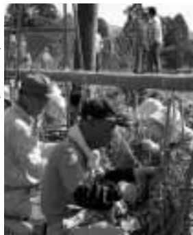
▶11年目を迎えるえだまめまつり

「自分のできることをする」 そんなみんなのむらを思う気持ちが結束を生み、仲良く・楽しくむらづくりをしています。