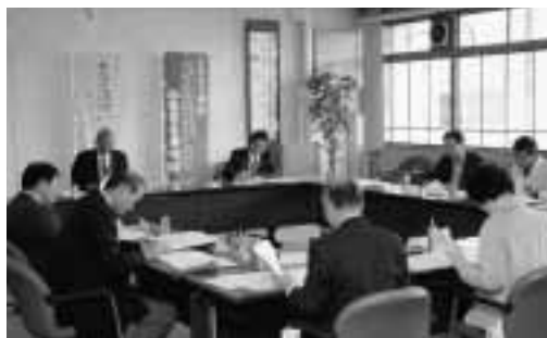
▲2次審査会の様子(10月29日)

ここでは、1次審査の結果を参考とし、両部門とも各審査員が投票により上位3点を選出しました。取材用公用車への使用などマークの用途に適したものととして、また、テレビ画面上に映えるデザインとして、ロゴマーク、キャラクターともに審査員全員で意見を積み上げ優秀賞を決定しました。