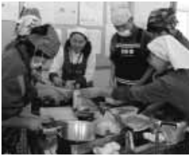
▲バランスのとれた食事を実践