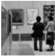
▶美しい作品を堪能