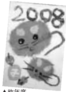
▲昨年度 子どもの部金賞作品