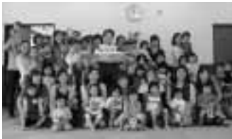
▲英語って楽しい!大人気でしたね