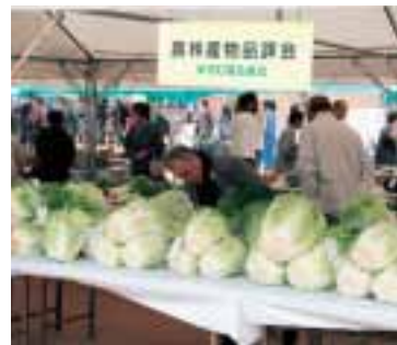
▲立派に育った農林産物が並ぶ