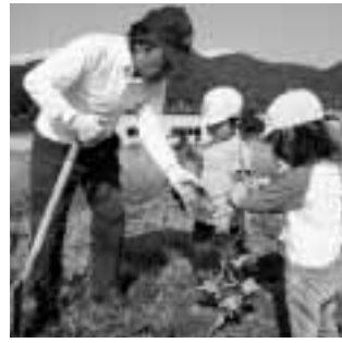
▲仕出原老人会と一緒に芋掘り

10月21日、キッズランドやちよでサツマイモ掘りが行われました。 5月に園児たちと仕出原