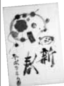
▲昨年度 一般の部金賞作品