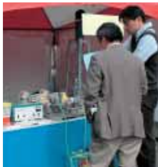
▶バイオディーゼルシステムをPR

企業・エコ展示コーナーでは「エコを考える」のテーマにちなみ、バイオディーゼルに関する商品の展示などが行われ、環境問題についてのPR・啓発が行われました。