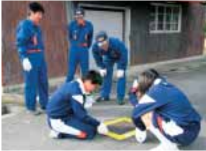
▲誰もが分かるように消火栓にペンキを塗る

「消防団の皆さんの苦労がよく分かりました。今後は、自分でも何か手伝えることがないか考えてみたいと思います」。