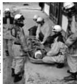
▶相互の円滑な連携を確認