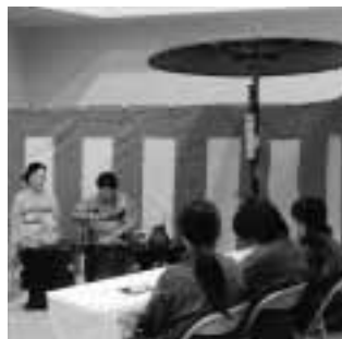
▲茶道を体験する中学生たち

皆さんが熱心に取り組まれた力作がそろった会場では、自分の作品と一緒に記念撮影する親子や、作品について楽しそうに語り合う女性グループなど多くの人でにぎわいました。また、会場