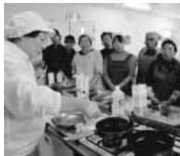
▲シカ肉の下仕込みの特徴を学ぶ