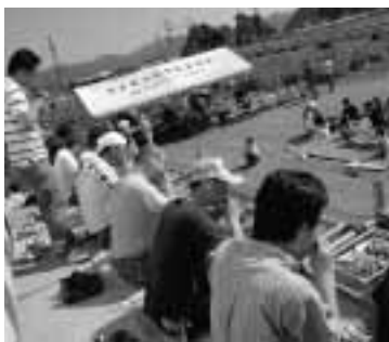
▲名物「枝豆の早食い競争」

お年寄りが生き生きと農業に励む山野部集落。集落内に放棄田はなく、草のないきちんと手入れされた田畑は山野部の自慢です。