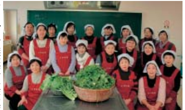
1月17日、生涯大学(あけぼの学園)への七草がゆサービス

いずみ会は、会員みんな、仲が良く、和気あいあいとしたグループです。食は毎日のことなので、難しく考えすぎるとしんどくなってしまうですが、興味のある方は、老若男女問わず、気軽に一度のぞいてください。」と話されました。