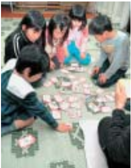
▶「播州弁方言かるた」に挑戦する子どもたち

1月12日、町内の2歳から小学1年生までの13人の子どもたちが集まり、図書館からた会を開催しました。