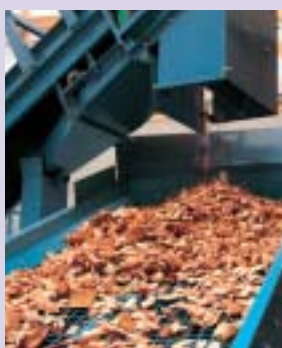
製造される木質チップ

自然環境に配慮し、次の世代に豊かな環境を残すこと、皆さんも、もう一度、エネルギー問題について真剣に考えてみませんか。