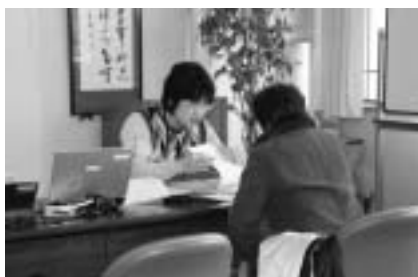
▲「ねんきん特別便」相談窓口開設 (1月23日、役場にて)