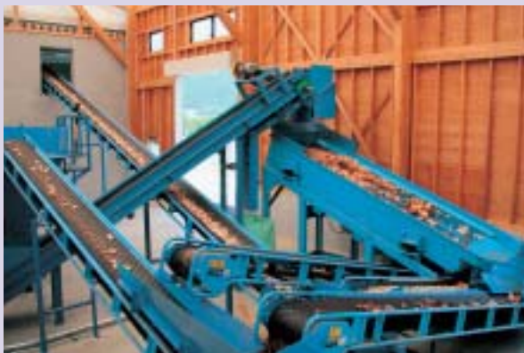
上／木質バイオマス供給施設全景 右／木質チップ生産ライン

木質バイオマス施設(利用供給施設)が竣工したのは、平成19年3月。森林荒廃と地球環境が深刻な局面をむかえ、社会全体が本格的に省エネや資源循環型社会の構築に歩み始めるなか、県下に先立ち完成し、稼働しています。