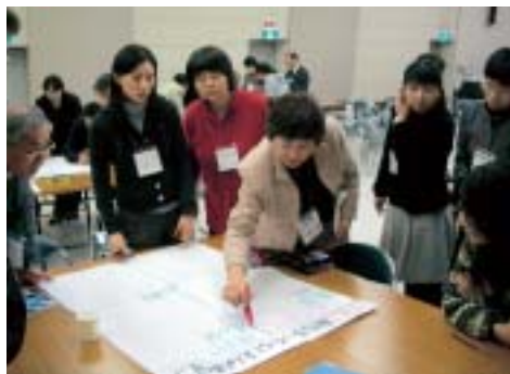
▶真剣に取り組む参加者たち

1月12日～13日の2日間、中央公民館で、多可町教育委員会とライオンズクラブ国際協会335D地区ラ