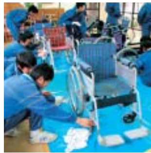
▲車いすを丁寧に磨く生徒たち

ちは、「おじいちゃん、おばあちゃんに喜んでもらいたい嬉しくなりました」と笑顔で語りました。