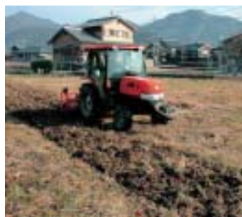
▲トラクターで耕される農地

1月10日、約13,000平方メートルの遊休農地を対象に、(財)多可町農林業公社が草刈り、耕起などを始めました。所有者の高齢化や転出で