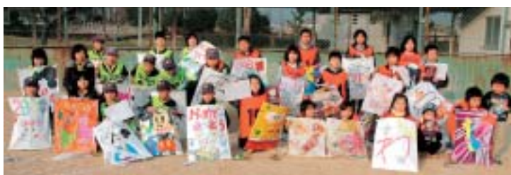
▲それぞれが手作りした凧を手に参加。デザイン、滞空時間などを競い合いました