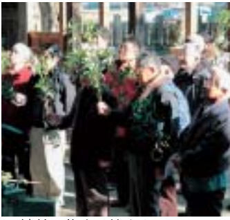
▲神前に集まる皆さん

皆さんは、一斉に「ウ・バラバラ」「ウ・バラバラ」と唱えました。このお神酒は、一昨年の12月に、地元の有志が地域のお米を使って完成させたオリジナル酒。その名はズバリ、「雨散散(う・ばらばら)」。お神酒の滴がシキミにたくさん着いた人が良いと言われていて、集まった皆さんは、降りかけられるお神酒に向かってシキミの枝を上下していました。