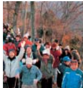
▲初日の出にバンザイ

1月1日、千ヶ峰(加美区)、浅香山(中区)、城山(八千代区)など、各地でご来光登山が行われ、多くの皆さんが参加し、初日の出とともに新年