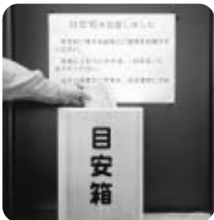
▲設置された目安箱

来庁して気づかれた事、町政に関する意見など、皆さんの生の意見をお聞かせください。