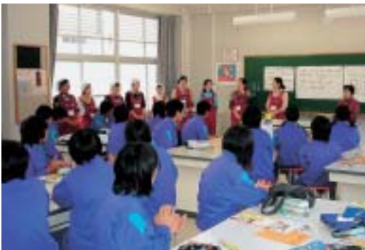
加美中学校2年生を対象に開催した食育教室「しつかり朝ご飯を食べていますか？」