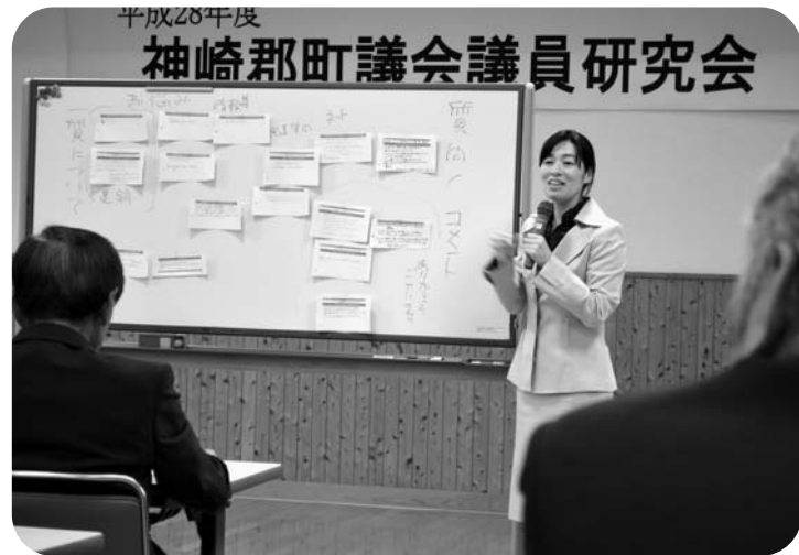
熱弁をふるう土山教授