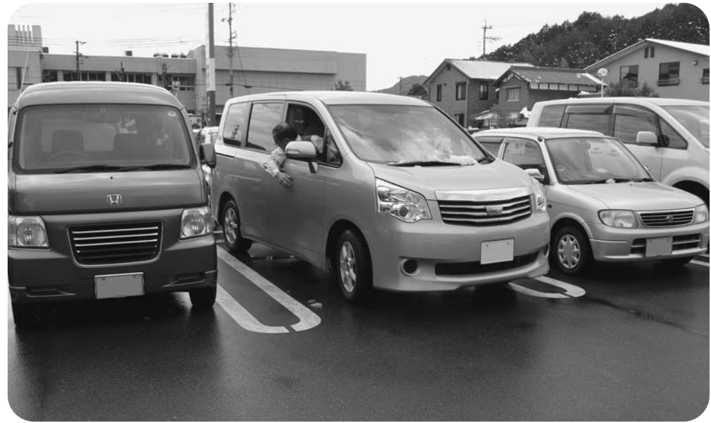
なかなか上手に止めれんのお

はありません。そこで、全国に先駆けて高齢者の運転技術に町が積極的に関わる施策を展開してはどうでしょうか。