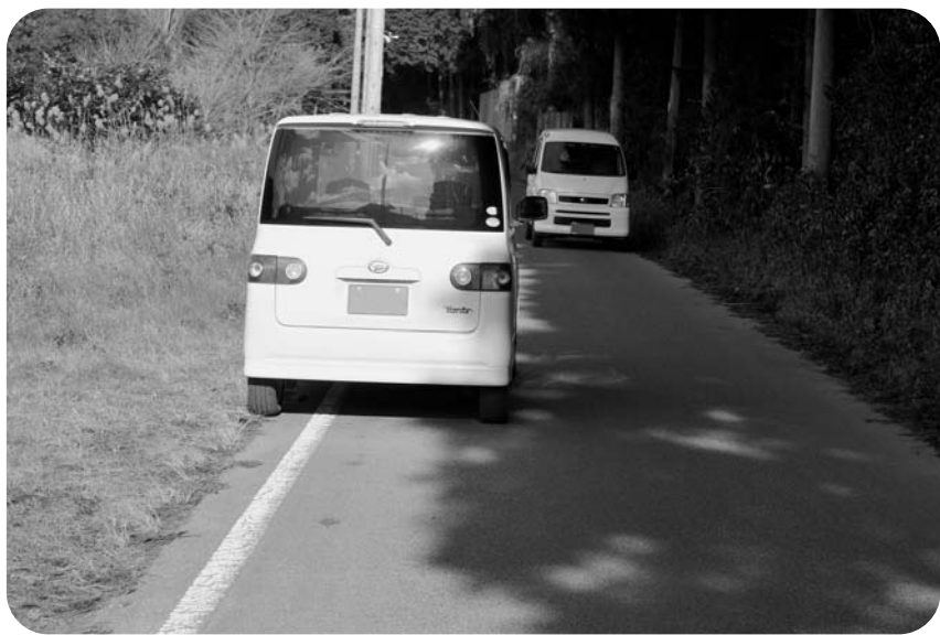
整備が待たれる川東線 — 大袋 —