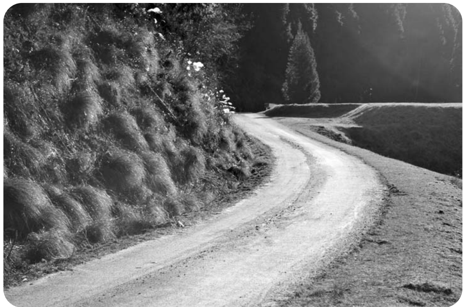
要望を続けている路線 — 柳山寺 —