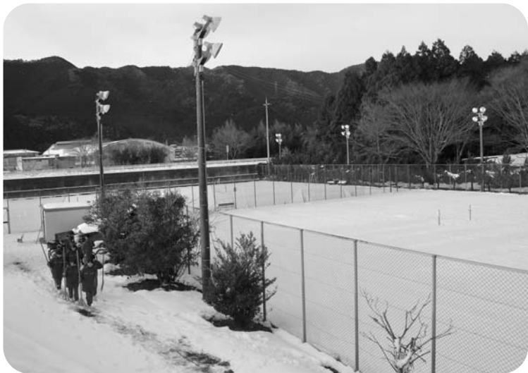
一面雪景色 整備中のテニスコート

さらに周辺整備も全くできておらず、ネットは破れ、トイレの鍵や時計も壊れています。(株)NSIが管理するまでは、夏休みや連休を利用して、「青年の家」に多くの人が宿泊されて