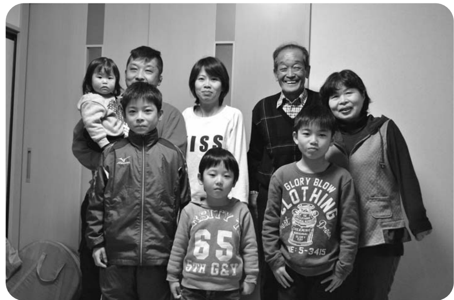
3世代で毎日にぎやかに楽しく暮らしています

現在地方創生事業として いる各種の事業とも絡め ながらブラッシュアップ させることです。 地方創生を滞ることな く着実に推進します。