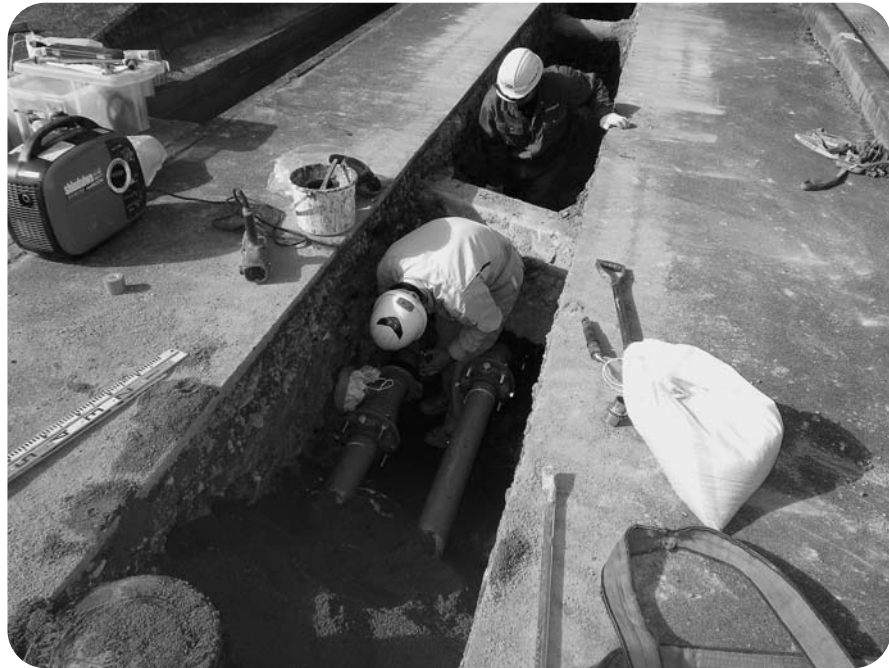
安全安心な水を届けるために

その対策として浄水設備の統廃合や市町村の枠を超えての事業の統合が考えられています。町長も、いち早く兵庫県で構成する水道事業の「あり方を考える会」を