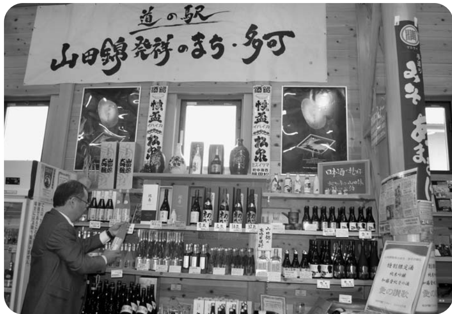
多可町産山田錦を使ったお酒はとってもおいしいよ

町長 「IWC2016」では、審査員向けの行事として、セミナーや蔵人との交流、県内施設見学、消費者向けとして、日本酒チャリティの飲み比べ会、それから地域経済への波及として独自の日本酒イベントが開催されました。灘の酒を売り出そうというのが、兵庫県の主な目的です。その「灘」の関連で三木市吉川で行事が開催されました。次回の兵庫県での開催では、県、関係機関とも