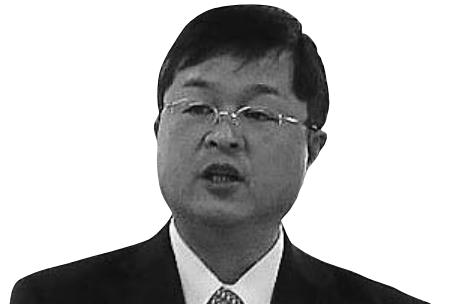
辻 誠一 議員