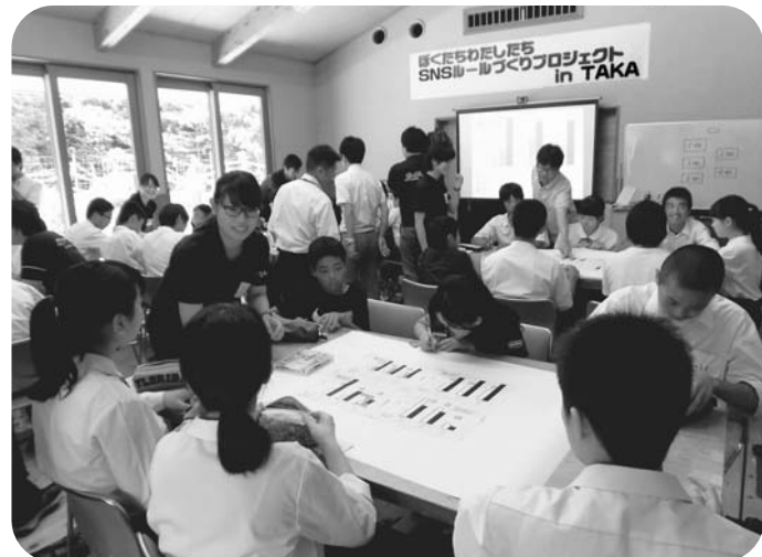
小中学生が自ら決めたSNSのルール

26年度より「夜9時以降SNSやリマゼン運動」を展開してきました。この運動をより推進し、実効性を高めるために、今年