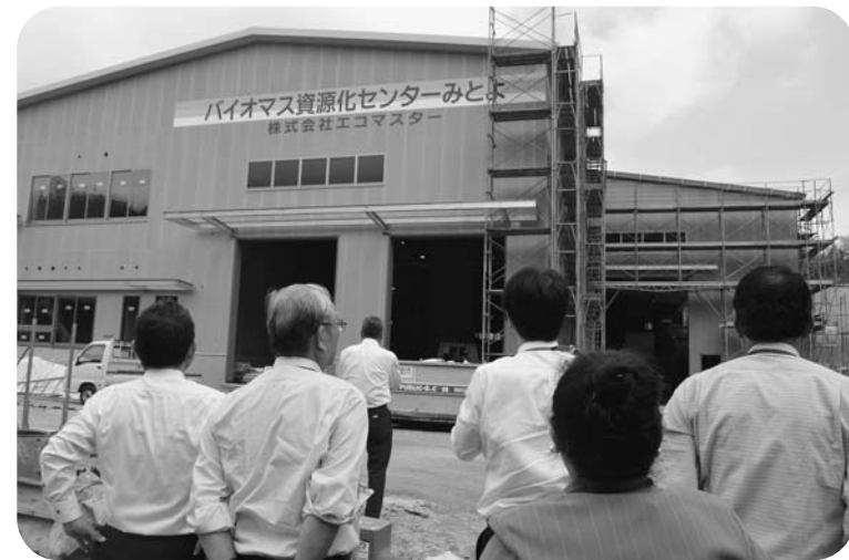
民設民営で整備されるゴミ処理場 — 香川県三豊市 —

た、高齢者の「居場所」 が整備されています。 地域によっては、キッ スサポーターの養成講座 を実施され、児童たちに も認知症の理解を深めて もらう取り組みがなされ、 地域の特色を生かした内 容となっています。 その背景には地域と行 政の協働を基盤に先を見 据えた粘り強さと信念を 感じました。 また、約17億円も必要 な処理施設や整備・運営 も民間企業に委託し、巨 額の整備費用が不要で、 固定資産税収の増加と雇 用の創出に繋がり（収集 も民間業者で）、財政規 律の適正化に大きく役立 つ取り組みです。 西脇・多可の可燃ゴミ 処理方式として検討すべ きと思いました。