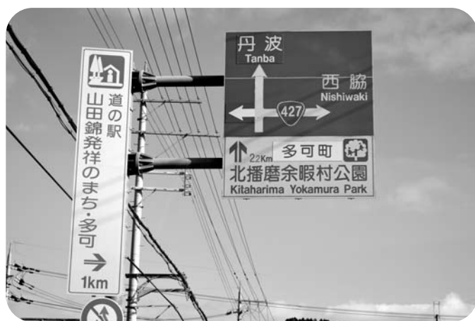
案内標識が多可町のPR看板になります

除し、「多可町余暇村公園」に変更することになりました。 問 名称変更に伴う標識の書き換え費用は誰が負担するのですか。 答 県とも調整しますが、300万円程度は必要になる見込みです。