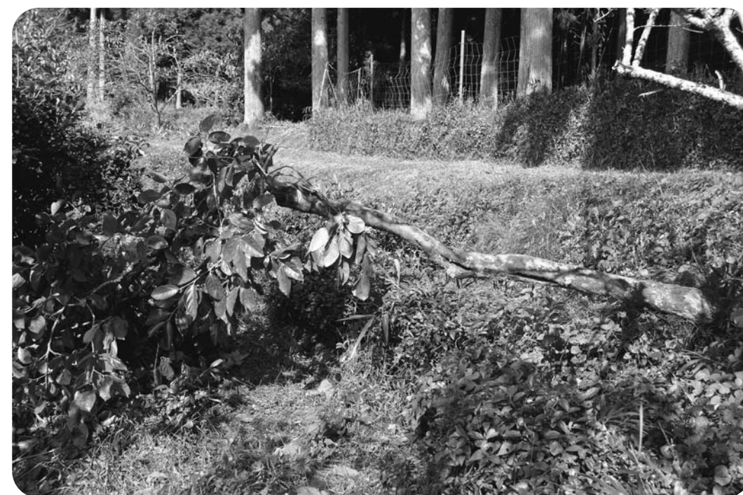
根元から熊に倒された柿の木 — 奥荒田 —