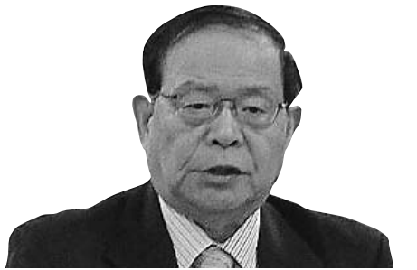
橋尾 哲夫 議員