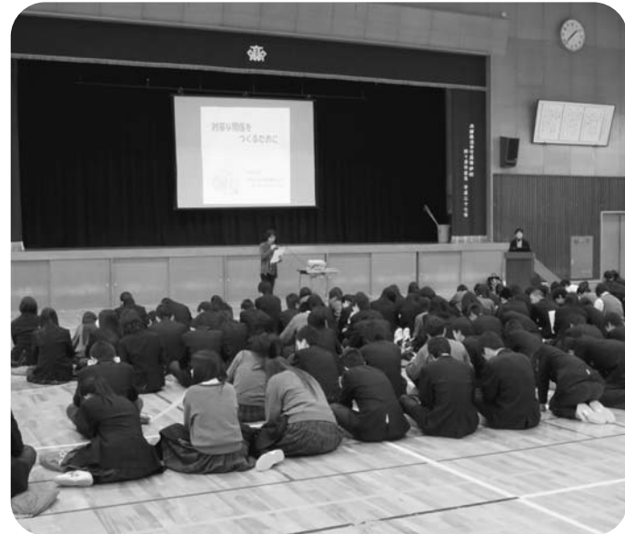
対等な関係をつくるために — 真剣に学ぶ多可高生 —

現在、個性や能力を十分発揮できる「男女共同参画社会」の実現に向けたさまざまな取り組みが進められています。