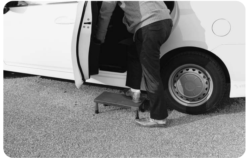
タクシーも踏み台がないと乗れません

各区内に1台ずつの合計3台を365日、朝8時から17時まで貸し切った場合、その費用は3285万円になります。現在、西脇への直行バスを除く町内を巡回して