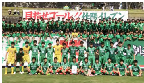
▲県大会を制した作陽高校サッカー部