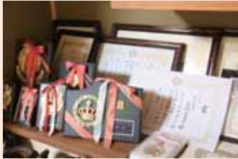
▲これまでに数々の賞を受賞