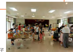
昨年度「かえっこバザール」の様子

◇バンクやレジ、オークションなどをお手伝いしてくれる小・中学生のボランティアスタッフも大歓迎!