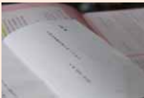
◀これまでの作品はすべて大事に保管されている