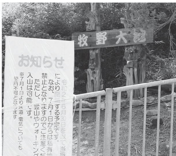
長年親しまれた牧野大地キャンプ場

A 例えばテントサイトの入り口に案内板を立てるなどをして、しっかりと周知します。