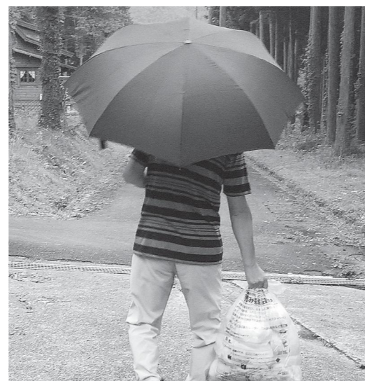
ごみ出しはひと苦労

Q いくつになっても、住み慣れた地域や家で暮らしたいものです。今年3月からごみ出し支援への特別交付税措置が始まっています。