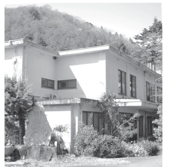
長い間ありがとう 林泉荘

Q 先日完了した林泉荘の撤去費用はすべて借金で、交付税措置もなく、後年度の返済です。 今回のような長年利用してきた施設は、撤去時まで利用してきた住民が便益を得てきました。しかし、撤去時点以降の住民には何の便益もないのです。 世代間の公平性の観点からも今後の公共施設の撤去費用は、公共施設整備基金に積み立てておき、基金を利用して後世にツケを回すべきではありません。 町長 提案の趣旨は、そのとおりだと思います。 財政調整基金を取り崩して運営している現在の財政状況の中では、すべての公共施設の撤去について基金積み立ては難しいです。 財政状況を見ながら起債にするか基金積み立てをして捻出するか、柔軟性を持たせながら事業実施をします。