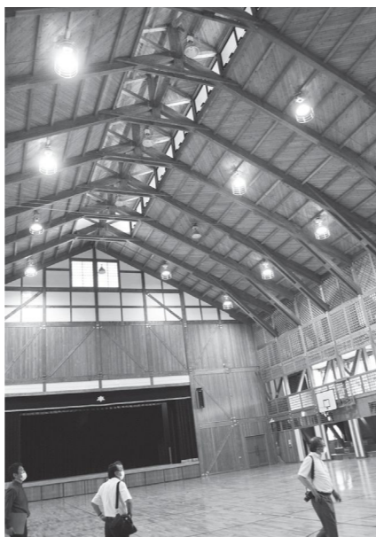
高い天井やなあー加美中体育館ー

GIGAスクール構想 早期実現に向けて 児童生徒用 コンピュータ購入ほか 9967万円 国のGIGAスクール構想に伴い、児童、生徒用に一人1台のパソコンを準備します。