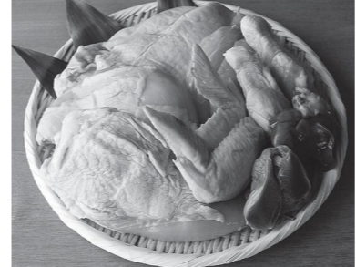
特産品を盛り上げよう

北播磨広域定住自立圏 特産品販売負担金 440万円 売り上げが落ち込んでいる特産品の販売を応援する商品券です。1人1セット(1000円券10枚/1万円分)を5000円で購入できます。