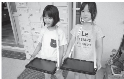
1人1台のタブレットを

臨時休業中の家庭学習を支援 学校教育課 課題の配布方法は、各学校へのポスティングまたは学校の安心メール、HPを活用しながら配布しました。 回収の方法は、 学校に回収箱を設置。自由な時間に子どもや保護者が持って来る「課題をポストインする」時に回収する」の2つの方法です。 家庭学習を充実させるために、たかTVなどを使って動画を配信していますが、その