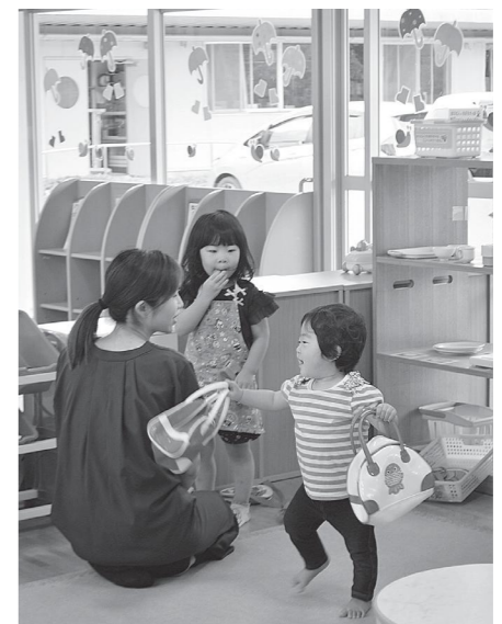
もっともっと遊ぼうよ —子育てふれあいセンター—

Q 周知方法は、対象世帯にチラシなどを送付します。 Q なぜ町独自で上乗せするのですか。 A 子育て世帯は、休業などで出費がかさみ、さらに支援が必要です。財源は、夏祭りなど、中止になったイベントの事業費などを充てます。