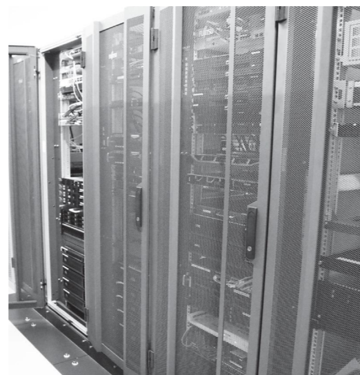
自庁で管理するサーバー

Q これまで個々に構築されてきた情報システムや住民基本台帳、税務、福祉などの行政データを、外部センターで管理運用し、複数自治体での共同使用がクラウド化です。 「自前構築型」から「サービス利用型」へ大きく変化し、安全性・人材育成・経費削減などができます。 現在の自庁方式から共同方式へ、自治体クラウドの取り組みについて町長の認識を問います。 町長 現在、自庁方式をとっていますが、多くの分野でデジタル化が加速的に進んでいます。住民にとって有益なデジタル社会に向けて、より安価で費用対効果の高いものを選択し、常に新しい技術の導入に向けて取り組んでいます。 更に①TKC社との交渉②LGWANSI A S P 共同化③TAS Kクラウドの導入などあらゆる選択肢を視野に取り組みます。