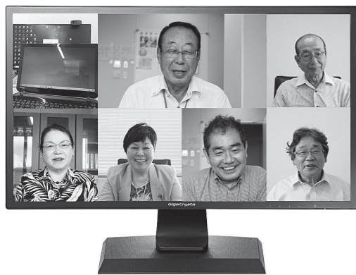
楽しくチャレンジ オンライン委員会

議会ICT推進特別委員会では、議員活動および議会活動の活性化を進めています。本年3月の定例会でタブレット端末と運用するシステムの予算が可決され、導入に向けて現実味が増してきました。 導入計画 ①8月の導入に合わせて議員の操作とスキル向上の研修予定。 ②10月からタブレット端末の本会議、委員会での活用。 ③グループウェアアプリを導入、議員・事務局のコミュニケーションの合理化と、災害緊急対応を可能にする。 導入後しばらくは紙とデータの併用が続くと予想しています。できるだけ早い時期に、データだけに移行し、スピード感を持つた議会活動と執行部との連携、またオンライン委員会も視野に入れた活動につなげます。 (日原)