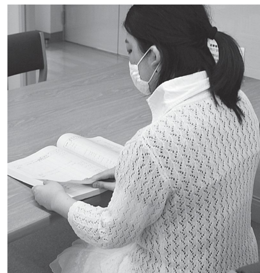
早く大学に戻りたい

Q 新型コロナウイルス発生後、大学生を持つ親から「入学したが大学も始まらず、アルバイトもできません。親の仕事も制限され、パートで勤めていたが辞めなくてはならず、収入が大幅に減少し、授業料も払えません。」と言われていきます。 多可町には「白川教育生活支援基金」があります。この基金を利用して、多可町出身の大学生に無利子の貸与型奨学金やひとり親の学生に給付をするべき