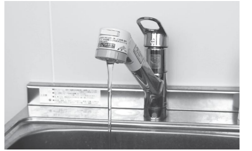
基本料金が無料に

Q 他市は買っている A 少しでも住民負担を軽減するためです。 Q 財源は何を充てるのですか。 A 一般財源の財政調整基金から、1億円を繰り入れます。