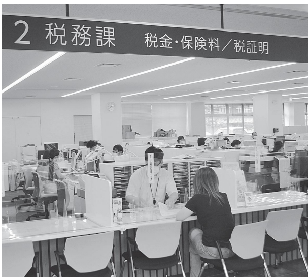
丁寧に対応します