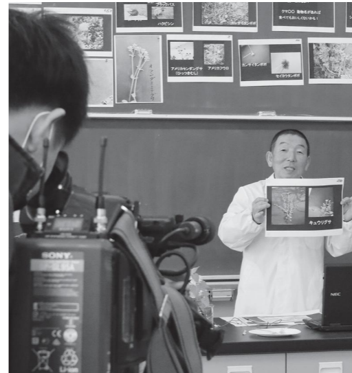
ただ今収録中 オンライン授業

新型コロナウイルスの感染拡大で、全国の小・中・高校などが臨時休業になる中、国はオンライン教育を推奨しています。ICT活用は教育政策の重要な課題であり、国はGIGAスクール構想を進めています。 コロナウイルスの第2波が襲ってくると考えられる中、オンライン授業をできることが重要になります。 町のオンライン教育の現状や問題点、GIGAスクールの中での取り組みを聞きます。 教育長 コロナウイルスの第2波を想定し、GIGAスクール構想を前倒しして整備を進めています。12月末までに学校内のネットワーク環境と、1人1台のタブレットの整備を目指しています。 また、家庭からアクセスできるクラウド上の教育プラットフォームの構築や、教員のスキルアップ、サポート態勢の整備が取り組むべき課題です。