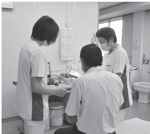
町民の健康を守るー松井庄診療所ー