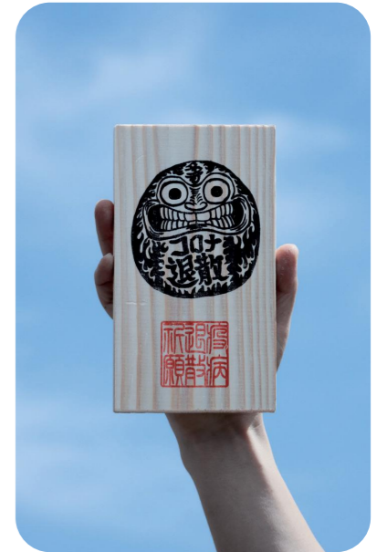
このお礼が多可町を救う

Q 国の持続化給付金から外れた事業者に、町単独で給付することになりましたが。 A 7月中旬から受け付けを開始する予定ですが、多くの事業所が該当するため、混雑が予想されます。専用の受付窓口や人員配置などの準備を進め対応します。