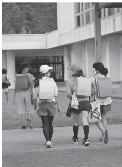
今日の給食は何だろう

義務教育費国庫負担が無くなれば、財源の厳しい自治体では、教育に十分な予算を回すことができません。子どもたちの教育条件に地域による格差を生じさせてはいけません。同じ水準の教育を国の責任で保障すべきです。