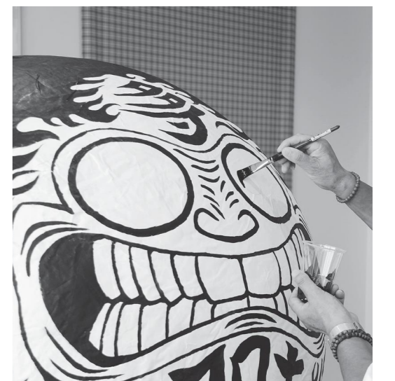
みんなで応援しよう 招福 多可応援符

町長 事業所、飲食業など大変厳しい状況です。国の持続化給付金の支援対象から外れ、困窮している事業者に対し独自の給付支援を検討します。