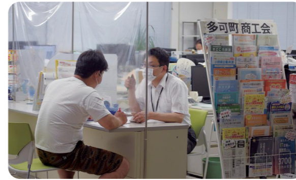
会員でなくてもお気軽に