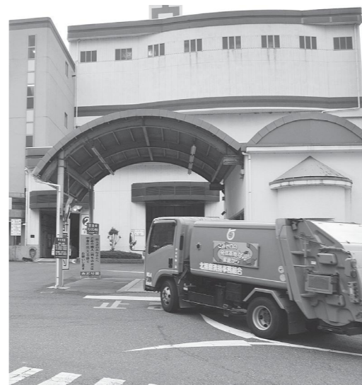
活躍するごみ収集車

Q 小野市などが予定している新ごみ処理施設の維持管理費は、人口割、ごみの量、距離などを考慮し決定されるそうです。 100年に一度の災害コロナ禍で、社会情勢が大きく変化し、町財政はますます厳しくなります。 町民負担軽減のため、新ごみ施設計画は見直すべきです。 町長 広域でのごみ施設運営で、町の運搬費を負担されるのが事実なら検討の価値があると、12月に答弁しました。 一番遠い多可町のごみ処理にかかる運搬費の負担を、すべての構成市町と調整することは困難です。 町民負担の軽減にはならないため、計画どおり一市一町で取り組んでいきます。