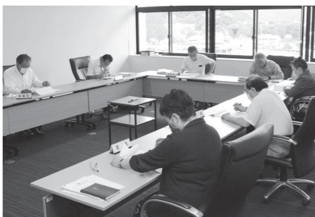
円滑な議会活動のために

議会運営委員会は、本会議の日程調整や議案の進行を確認し、円滑な議会活動を推進するよう設置されています。