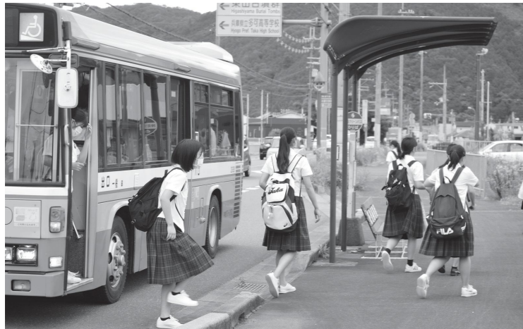
たくさん的高校生が利用しています