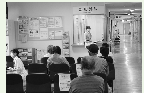
頼りにしてまっせ —多可赤十字病院—