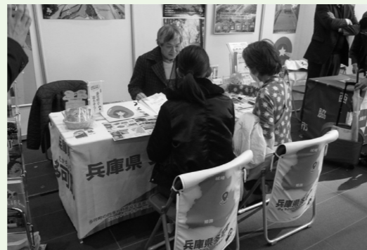
多可町へいらっしゃい —移住相談会—