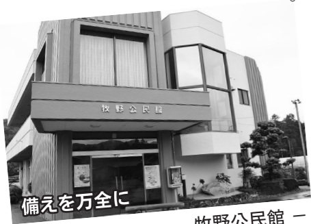
— 牧野公民館 —

各集落30万円を上限で補助します。集落の規模は異なりますが、同額です。一律30万円です。