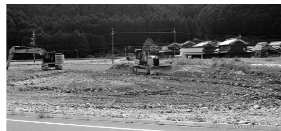
建設に向けて造成中 一管轄残土処分地

Q この事業は発電だけでなく地域への還元も視野に入れています。有効活用の詳細は、