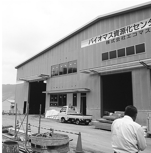
エネルギー利用を目指して ごみ処理施設建設