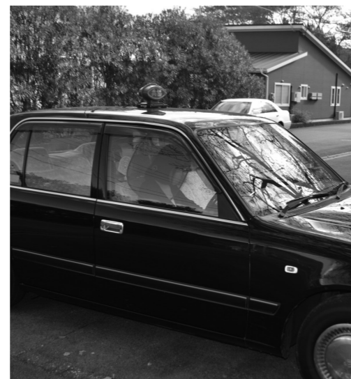
今日も元気で走ります

町長 本町では、移送・移動の手段としてバスとタクシーがあり、利用の困難な人には、外出支援サービスもあります。令和元年度の福祉タクシー券申請者は1136人、そのうち24枚全て使った人は416人です。詳細な分析を進め、制度の改革と維持に努めます。