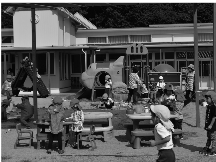
今日も元気いっぱい —キッズランドかみ—

近隣市町でも同様の販売数字です。また、全世帯対象ではなく特定の人が対象であったのも一因と考えています。