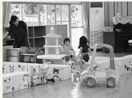
おもちゃがいっぱい楽しいなあ —子育てふれあいセンター—