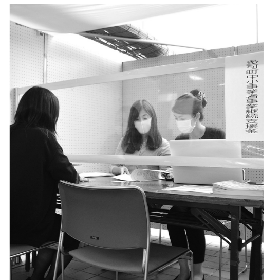
丁寧な対応 —多可町商工会—

町長 水道基本料金の減免や感染症対策、事業者への経営継続支援など数多く実施してきました。町が地域の実情に合わせて、思い切った必要な施策を実施していくことは必要です。住民の皆さんにとってどんなことが必要かを検討し、町独自の施策をためらわずに実施します。