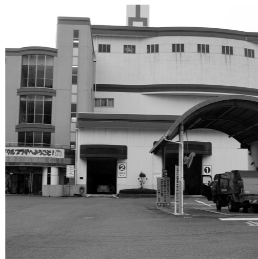
もうすでに耐用年数は過ぎている —みどり園—

町長 基本計画の見直しは、廃棄物処理などに関する関係法令が改正された場合で、現時点で改正はなく見直しません。 ① 耐用年数は20年で、すでに10年間長寿命化対策をしています。 ② 意見書への回答は、西脇多可行政事務組合と改良区で現在協議を進めています。 ③ 農林水産省と協議中です。新ごみ処理施設は1市1町で令和6年4月の稼働を目指します。