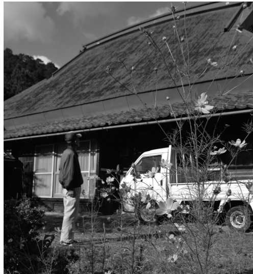
空き家を活用しよう

Q 企業懇話会が「大人のインターンシップ×多可町暮らしの体験」事業を進めています。しかし、就職が決まっても空き家バンクに賃貸物件が少なく、購入するにも資金面などで住居確保が困難です。まず、単身でも入居できる町営住宅を活用してお試し住宅を拡大してはどうですか。