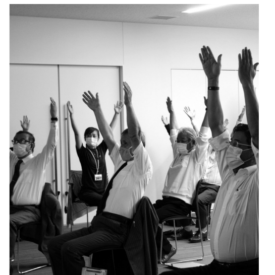
けっこう大変 いきいき百歳体操

町長 大変重要な問題と認識しています。取り組みとして「早期発見・早期対応」「予防の実践」「見守り体制の構築と普及啓発」の3つの事業を展開しています。認知症サポーター養成講座は、平成20年度から122回開催し、延べ3929人が参加