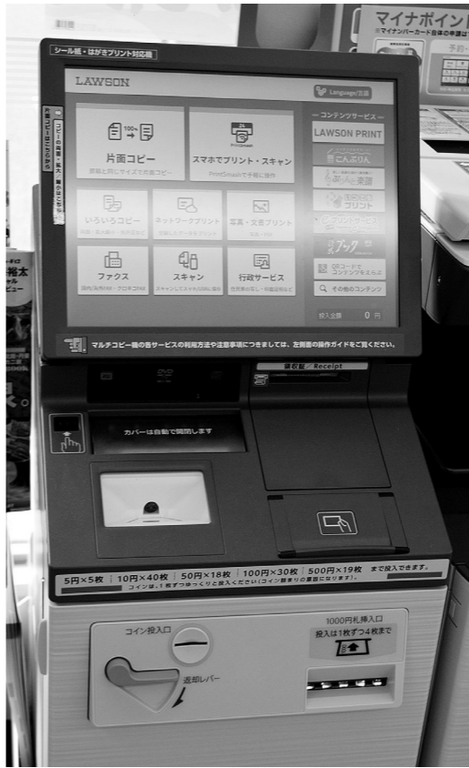
操作は簡単 多機能端末

A 例えば住民票は、窓口交付で300円のところ、コンビニ交付では200円になります。