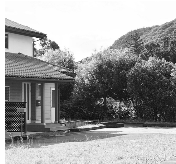
景観が気になる生け垣

Q 町営住宅の入居者は、低木の植木の剪定などをする必要があります。町営住宅の隣接地に沿って植えてある生け垣が3メートル程度になっていて、作業が困難となっています。管理しやすいように、生け垣ではなく、金属製のフェンスなどに変更するように改善を求めます。