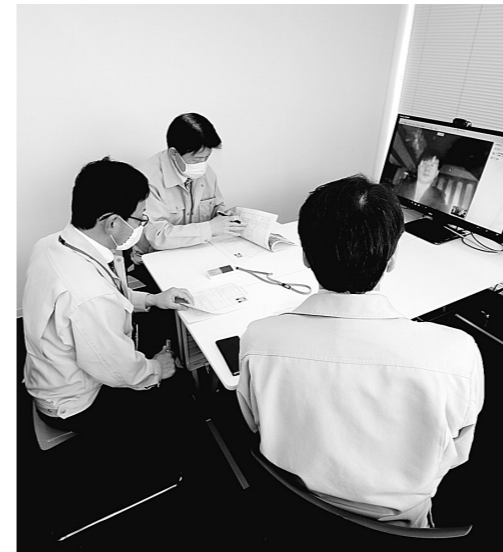
オンライン面接中 地域おこし協力隊

町長 コロナの第二波、第三波に備えるため、ICTを活用したテレワークの環境を整える必要があります。ただ、多くの個人情報などを取り扱っていることから、セキュリティの対策に注意を払う必要があります。今後もサテライトオフィスを活用しながら分散勤務を考えています。在宅ワークも重要なので、十分検討します。