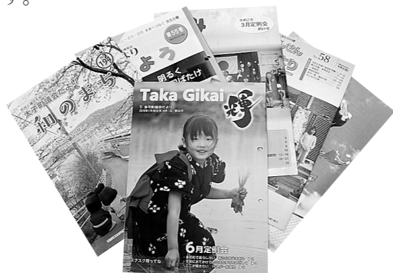
伝わりやすさにこだわります

多可町議会だよりでは、語尾の「です・ます」にこだわっています。紙面の関係で文字数を抑えるため言い切り調の議会だよりが多い中、このこだわりが、丁寧さと優しさを伝え、他との差別化になっているようです。