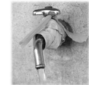
予防は手洗いから