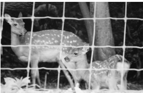
鳥獣防止柵で被害を防ぐ

鳥獣防止柵で被害を防ぐ 総合整備計画の変更 中三原地区での鳥獣害防止柵の設置事業で、防止柵の延長が必要となったため、事業費を増額します。