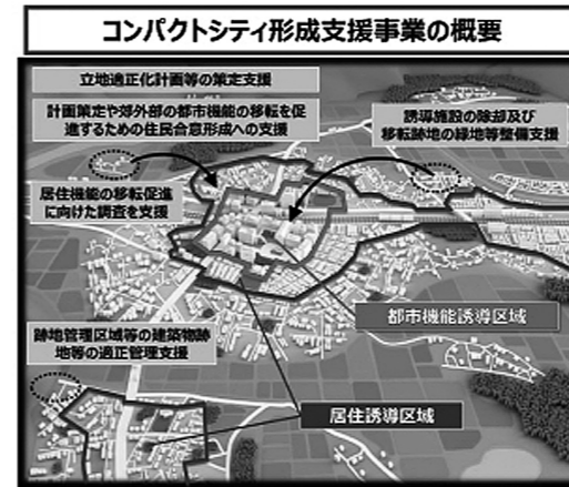
事前避難で命を守ろう

Q 近年の異常気象で各地に甚大な被害が続発し「尊い命、財産」が失われています。事前に危険から避難し「命」を守る取り組みができないでしょうか。多可町での土砂災害危険箇所は400カ所を超えています。