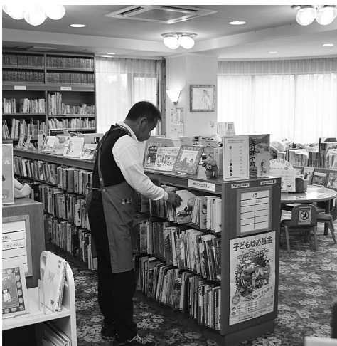
みんな来てね —多可町図書館—