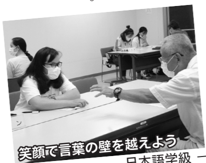
— 日本語学級 —