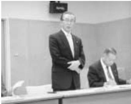
宝達志水町議長より歓迎のあいさつ

■ 行政改革調査特別委員会では、議員の定数について検討をはじめていきます。これまで、同委員会では、兵庫県内の佐用町など、同じような規模の町を訪ねて比較検討してきましたが、今回は議員全員で、多可町に比べると人口は少ないのですが、石川県羽咋郡の宝達志水町の議会を訪ねてきました。