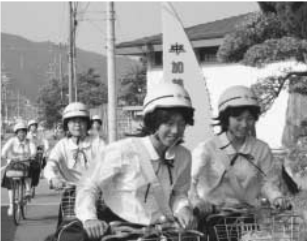
元気に登校していまあ～す ー加美中学校ー