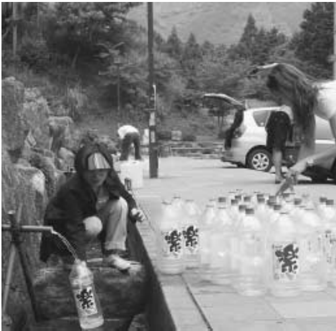
大人気の松か井の水

この機会に、公園の中に、「松か井の水」の歴史など、広く皆さんにわかっていただけのように、大きな看板を作ります。