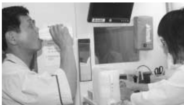
健康維持のためにも町ぐるみ健診を受けましょう