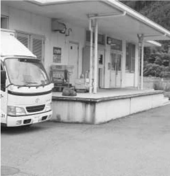
毎日おいしい給食を届けます - 八千代給食センター -

答 ジャグジー設置で快適性は高まり、中高年者の利用増が見込めます。ジャグジー棟は、水温を40度に高め、気泡を発生し、泡風呂の状態にします。