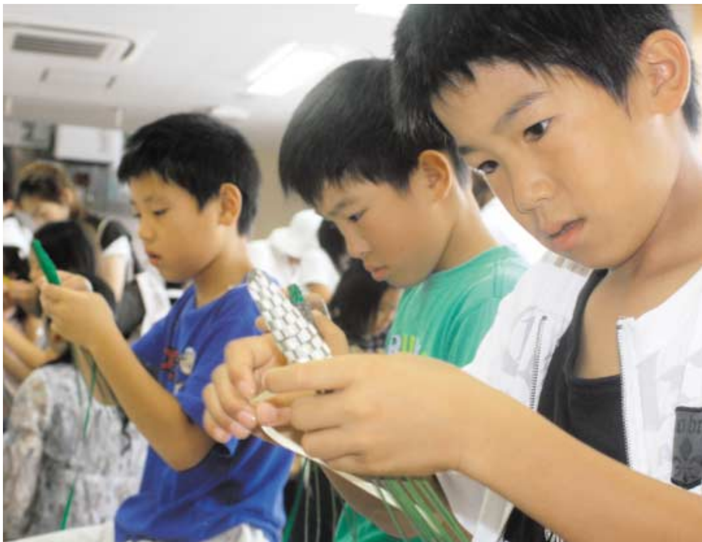
ラベンダースティック作りにとりくむ子ども達 ーラベンダーパーク多可ー