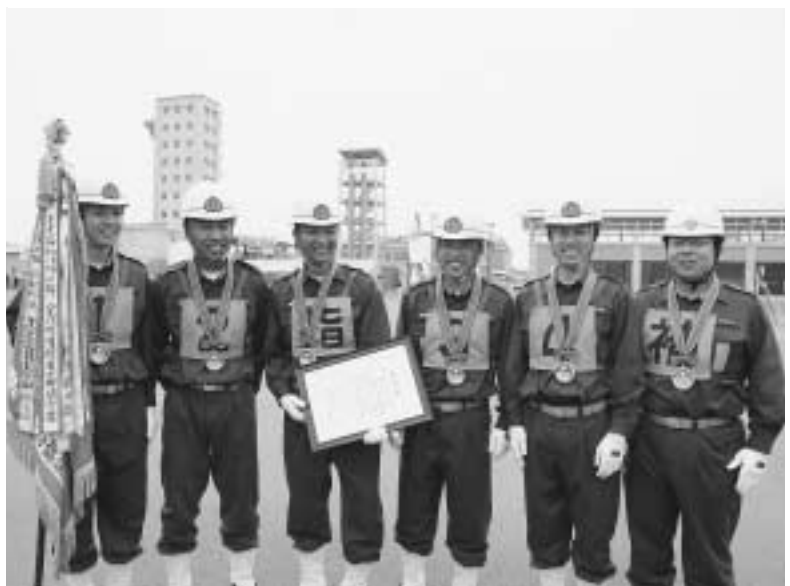
北播大会で優勝した第14分団特設第一部(中野間)の選手の皆さん

7月6日県立広域防災センター（三木市）で北播磨地区消防操法大会がありました。迅速・的確な操法の結果、「第14分団特設1部（八千代区中野間）」が、みごと優勝の栄冠を勝ち