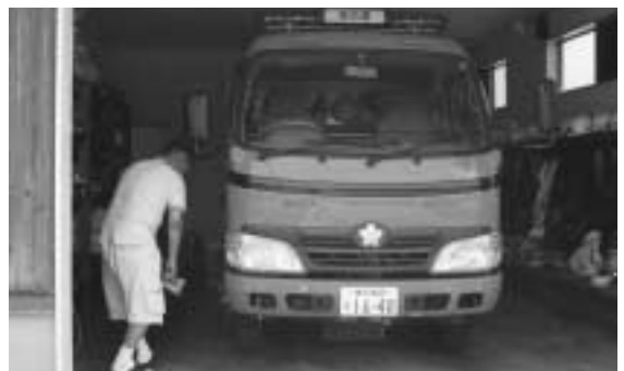
取るものも取りあえず

昼間団員の減少は全国的です。幹部からも女性団員制の声もあり、今後、OBの手助けなども、審議会、協議会などで検討していきます。