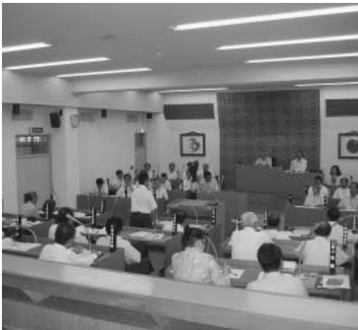
町政課題の解決に向けて真剣に議論