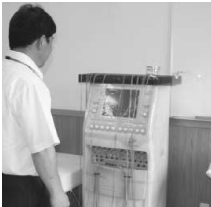
いまは借りもの これですと新しくなります