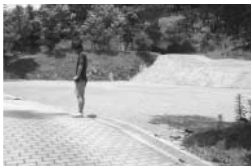
更地になった“ふるさと村やちよ”

ベン利用減を心配しています。提案の公認グラウンドゴルフ場については、社会教育課で生涯スポーツ振興計画に取り組んでいる最中であり、アンケート調査や委員さんの協議の結果を見て、前向きな検討課題としていきます。