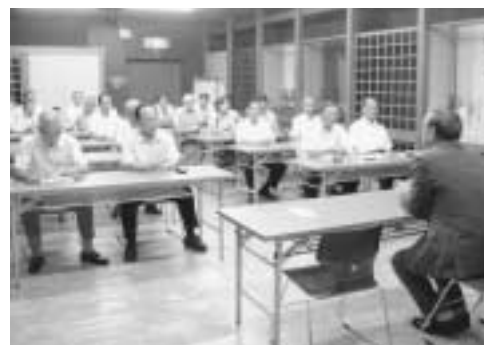
福光屋の常務さんからお話をうかがう

日本酒で乾杯の町、多可町。福光屋の常務さんから、「これからの山田錦に求めているもの」をテーマにお話いただき、酒蔵