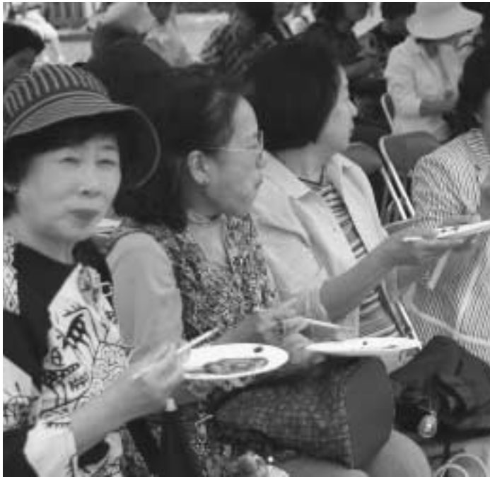
シカ肉料理に舌つづみ

答 入園料無料はNPO法人からの提示。町からの補てんはありません。この点はNPO法人にも確認しています。