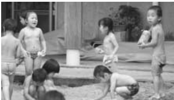
保育料の値下げを

議会への報告をせず改定したことはお詫びしますが、この度の改定は国基準の変更によるものです。また値上げの対象者は「そこそこ所得のある世帯」であり、相応の負担はお願いせざるを得ません。また他の自治体との