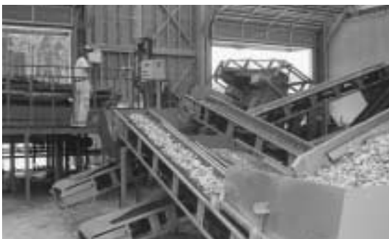
新エネルギーに生まれ変わる多可町の森林資源

①すでに他府県で実証されていない内容を提案されており、粉碎技術により微細化し、酵母により発酵、セルロースを糖化させ水を分離し、エタノールを取り出す処理法です。大学の参画のもと本町も参画を考えています。②林業振興、廃棄物有効利用、地球温暖化防止等、公益的側面から期待されるものが多く、今後は研究機関の大学中心に産・学・官連携して循環型経済社会システムの構築をしていきたいと考えています。