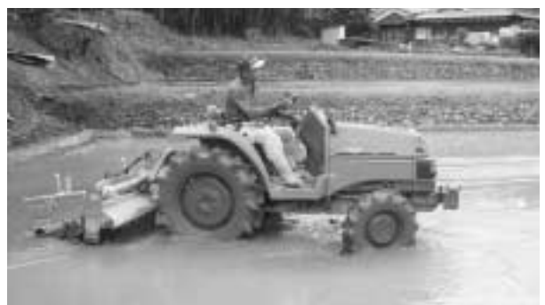
とどまらないガソリンの値上げ

辻 農業に使用する軽油は、かかる税金を免除する制度がありますが、ガソリンにはありません。しかし、農地を維持するためには、ガソリンも相当量使用します。ガソリン税を払い戻し方式で農家に還元したらどうですか。