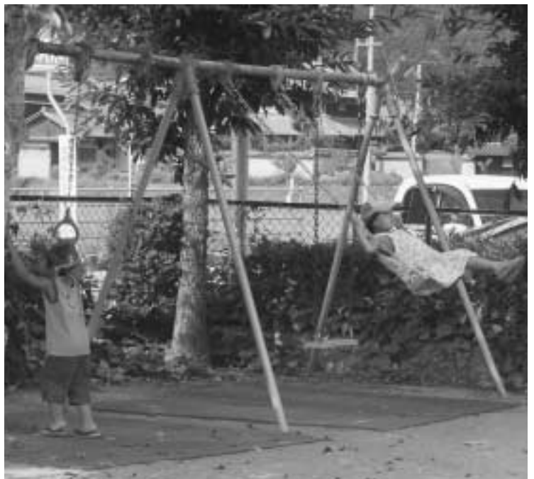
少子化対策は町の重要課題 — みなみ保育所 —

ますから、実質の値上げ額は月額で500円程度です。 ・委員会では引き続き保育料の設定方法について検討することにしました。