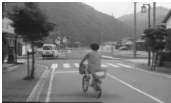
道路整備は特例債で

大西 合併特例債の効率的な運用を考えると、加美区にばかり使われているとの批判があり、中区はどうなっているのかとの意見も聞きます。特例債で中区としての協議事項はどうお考えか。