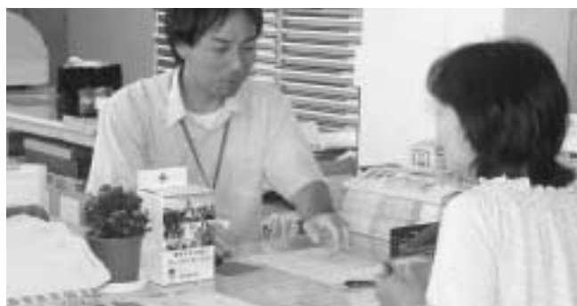
いいですねえ この窓口