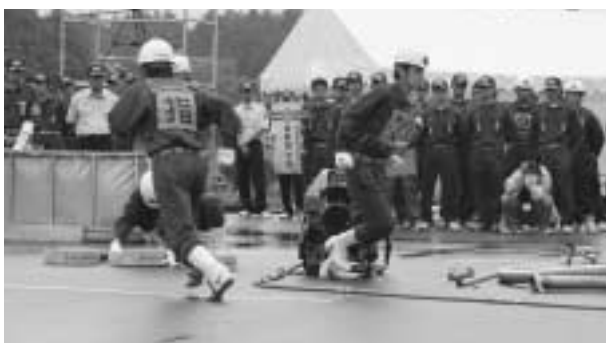
日頃の成果を発揮します