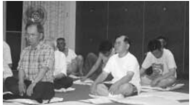
CATVの住民説明会 - 中区安楽田 -

清水 CATVを基軸にした「わが町の地域情報化」2011・7月のサービス開始に向け、その骨格が固まりつつあり正念場の今、本町の中軸をなす「地域情報化」の詳細な取り組み状況並びに町長の所信を問う。