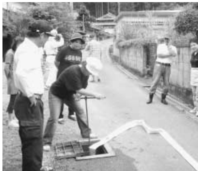
自分たちの手で地域の安全を守ります -加美区豊部-

大西 ①危機管理体制の充実度は。②多可町総合計画「自然災害の防止」「災害に強いまちづくり」について計画の進捗度は。