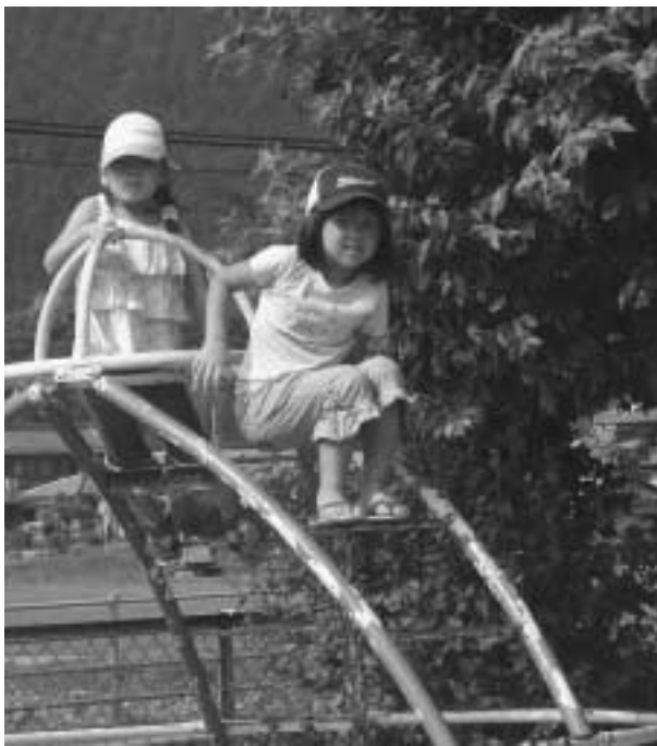
遊具は子どものおともだち — みなみ保育所 —

間伐材の搬出助成の拡充や、作業道開設、また経費削減から、複数の所有者が合体しての作業など、新たな展開も考えていきたいと思っています。