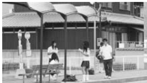
夕方は暗くなります — 多可高前バス停 —

被害を最小限にとどめるために、発生直後の正確な情報収集・的確で迅速な伝達のために消防署にお願いし、拠点サイレンの吹鳴・消防団員の招集・防災無線放送の順で、多