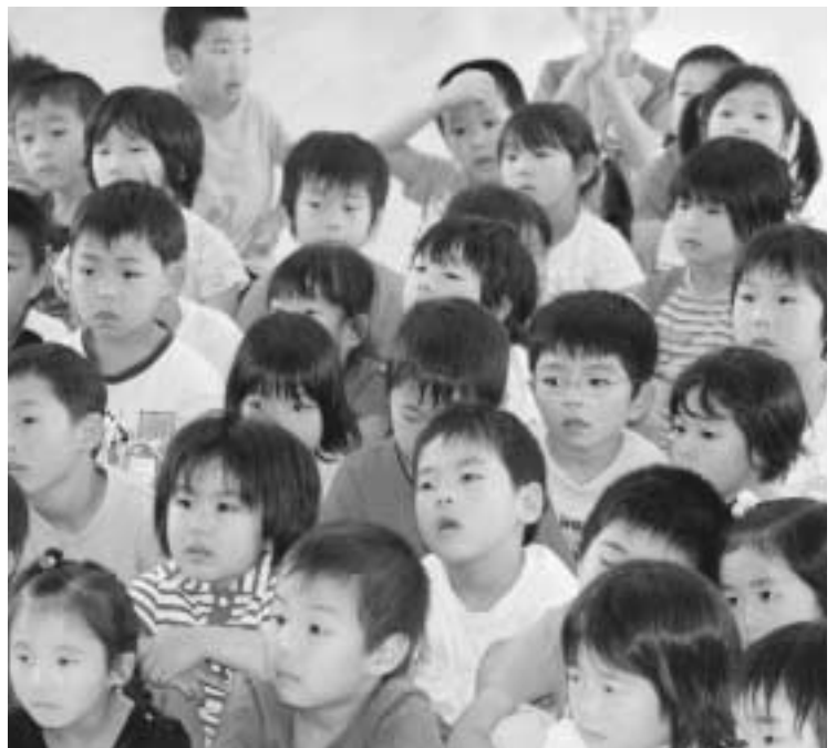
子育て支援で社会保障の充実を — 中町幼稚園 —

引き上げを押さえるために、国保基金から2000万円の繰入を決定。 6月議会では、固定資産割の引き下げを含めた税率を決めました。