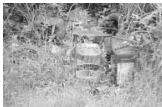
不法投棄にはキビシイ対処を