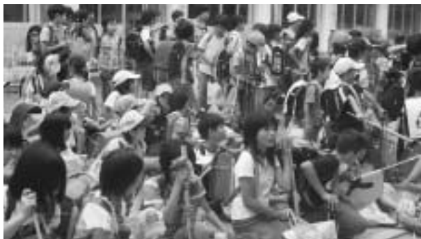
名札を忘れずに — 松井小学校 —

行政機関、民間事業者などが、個人情報の保護のためにと定めたのが、基本方針です。 法律を口実にした過剰反応であり、悲しい対応だと思います。