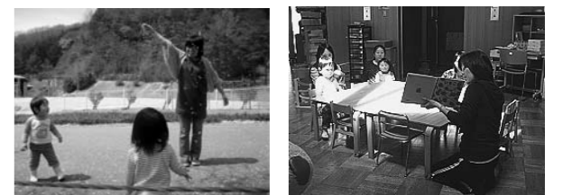
▲桜の花びらをパラパラパラ♪ ▲絵本タイム