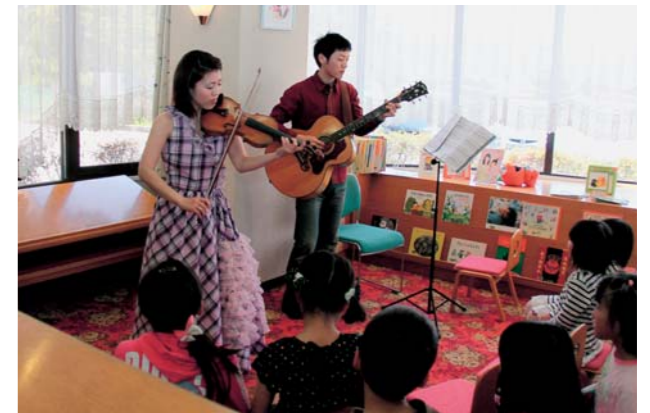
▲息の合ったセッションを披露

22日の本宮では、徳畑天神社に宮入り、それぞれの屋台が社殿の前で差し上げられるたびに参拝者から大きな拍手が起こりました。