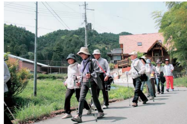
▲ポールウォーキングで運動量アップ！

この日参加した35人は、八千代区坂本の住民センターをスタートし、鹿子神社・ネイチャーパークかさかた・化け椿を巡る往復約7kmのコースにチャレンジ。さわやかな日差しのもと、九輪草や化け椿など自然と触れ合いながら青々とした新緑の中のウォーキングを楽しみました。