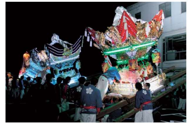
▲宵宮の役場前駐車場での点灯式