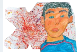
『前をみつめる自分』