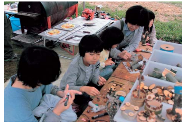
▲どんなおもちゃができるかな

たか坊やたかレンジャーも登場し、ダンスやゲームと一緒に参加するなど、会場を盛り上げていました。