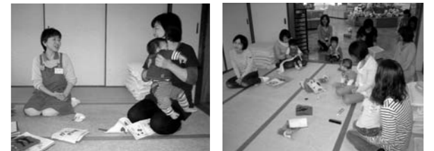
▲学習会後もちょっと質問 ▲子どもも同じ空間でお話を聞きました