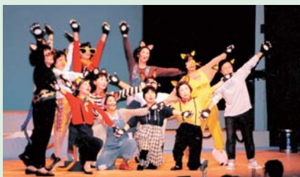
▲記念コンサートではミュージカルも