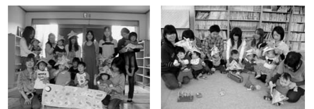
▲図書館に飾る鯉のぼり ▲新聞紙でかぶとを作ったようこ模様は手形と足形で