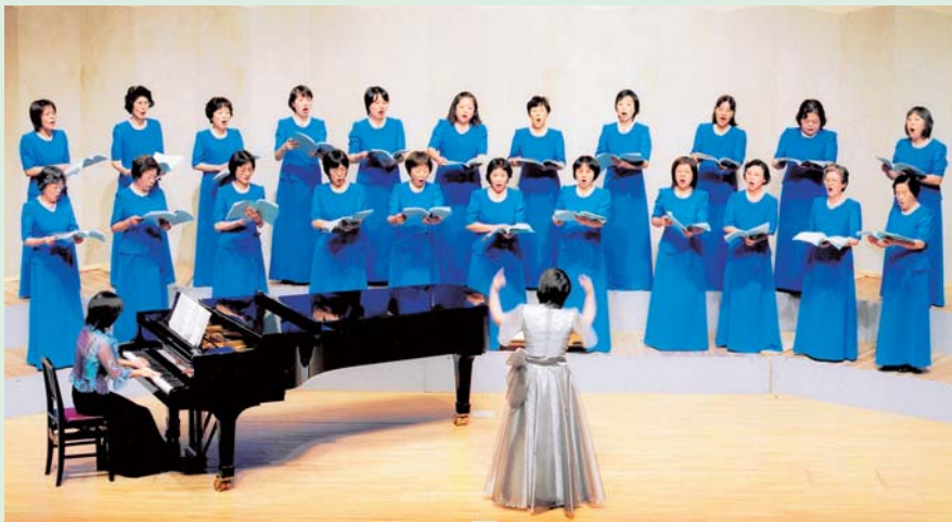
▲東はりま音楽祭での合唱ステージ