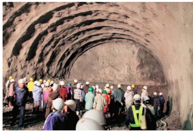
▲当日までに掘り進められた750m地点の様子

ところ 那珂ふれあい館 研修室 定 員 50人程度(要申込み) 申込締切 6月23日(土)まで 参加費 100円(資料代) 申込み・問合せ 那珂ふれあい館 ☎(32)0685 FAX(30)2730 休館日 月・火曜日(ただし、第3日曜日の週は第3日曜日と翌月曜日)、祝日・年末年始