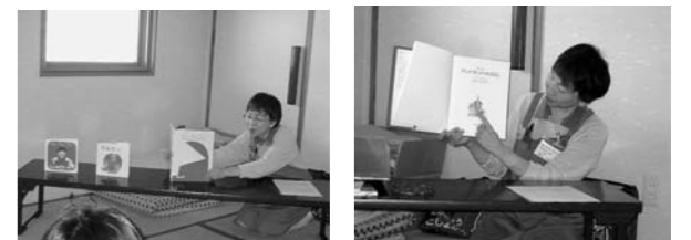
▲ことば絵本の紹介 ▲「グレイラビットのおはなし」