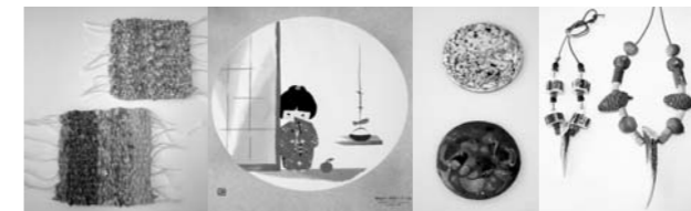
▲裂織コースター ▲ちぎり絵 ▲七宝焼き ▲マジカルネックレス

子育てふれあいセンター ☎(37)2525 ホームページ http://www.town.taka.lg.jp/kosodate/