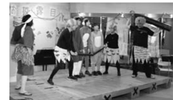
▲お披露目パーティーでのミニ芝居

町文化会館では平成9年から演劇セミナーを開催しており、この15年間で、演技だけでなく、やりたいことを自分たちでプロデュースするグループへと育ててきました。これまで培ってきたものを生かし、新たに「エン×ゲキ・プロジェクト」として動き出します。