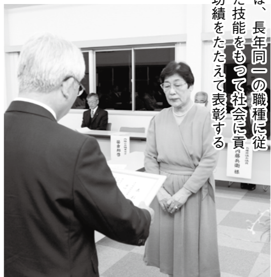
▲昨年の表彰式の様子

この制度は、長年同一の職種に従事し、優れた技能をもって社会に貢献した人の功績をたたえて表彰するものです。