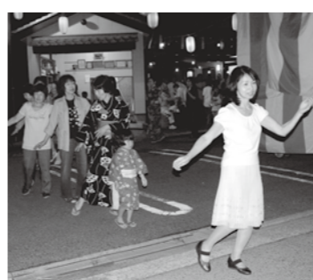
▲集落総出で盆おどりを楽しみます

小さなむらだからこそ全員参加のむらづくりが大事だと考えています。特に三世交代には力を入れており、ラジオ体操や盆おどり大会などは家族みんなが参加するため、参加人数の多さに驚かされるくらいです。