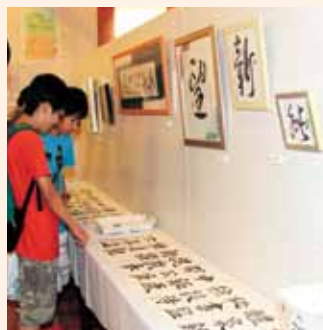
▲10年目となる清流の書展には毎年OB・OGも出展します