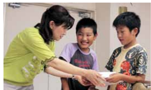
▲ぐるぐる開くしりとり絵本が完成