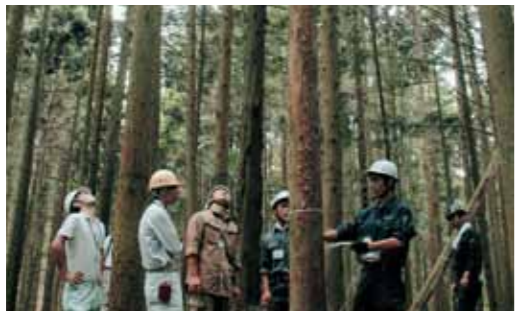
▲北はりま森林組合が先進地として会場に選ばれる

8月2日～4日、交流会館で全国森林組合連合会主催による『森林施業プランナー育成対策事業近畿プロジェクト基礎研修』が行われました。