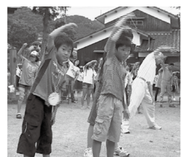
▲ラジオ体操で朝から元気！

何事も「全員で取り組む」のが坂本流。ヨチヨチ歩きの子どもからお年寄りまで、みんなの顔が見えるむらづくり。