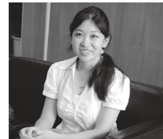
▲太鼓や生け花にもチャレンジしたい