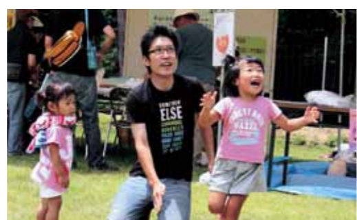
▲空へ舞い上がった竹とんぼを追いかけて

8月7日、那珂ふれあい館で『青少年のための科学の祭典』が行われました。会場には、30を超える体験ブースが登場。各ブースには、県内各地の高校生や中学生などのボランティアが参加し、工夫を凝らした企画で来場者に科学の魅力を伝えました。