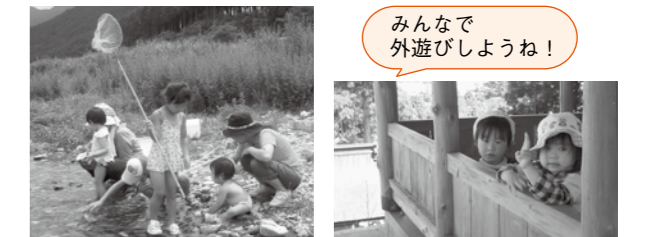
▲豊部で川遊び(7月) ▲靴屋公園(4月)

■とき 9月26日(月) 午前10時30分～11時30分 ■集合場所 石原坂トンネルの手前の空き地 ■内容 山登り ■持ち物 帽子、お茶 ※雨天時は東安田集落センターで遊びます。