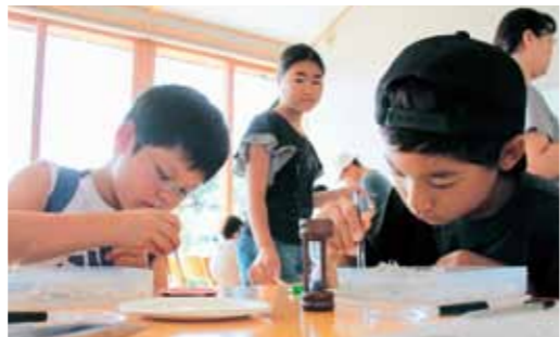
▲ちりめんじゃこの中に隠れている生き物を捜索中

8月7日、那珂ふれあい館で『青少年のための科学の祭典』が行われました。会場には、30を超える体験ブースが登場。各ブースには、県内各地の高校生や中学生などのボランティアが参加し、工夫を凝らした企画で来場者に科学の魅力を伝えました。