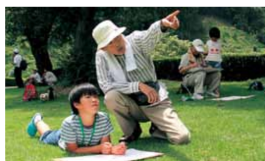
▲いなみ野学園絵画クラブのお年寄りと交流

8月3日、八千代区で『第13回おじいちゃんおばあちゃん絵を描こう会』を開催しました。