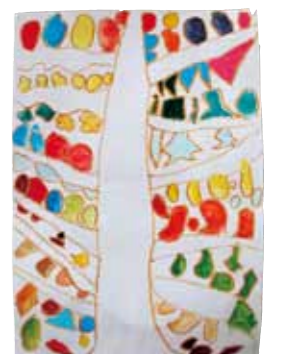
【色いろいろハッピーツリー】