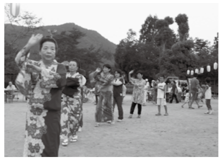
▲踊りが大好き！大きな輪がやぐらを囲みます

■岸上ぼんぼん祭 8月14日、加都良神社グラウンドでぼんぼん祭を開催しました。 当日は、地元の皆さんや岸上に縁のある人など約350人が集い、久しぶりの再会を喜ぶとともに、盆踊りや模擬店などを満喫しました。岸上の元気が詰まった楽しい夜になりました。