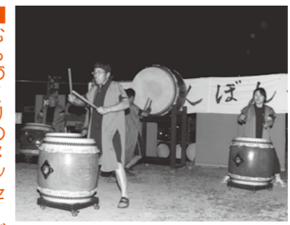
▲祭を盛り上げる有志の岸上だっこ

みんなそれぞれが活発に活動し、いろいろなアイデアでむらを盛り上げます。共通の思いは「住みやすい岸上をつくろう！」