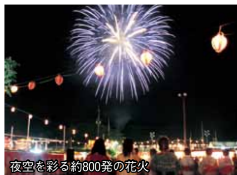
夜空を彩る約800発の花火