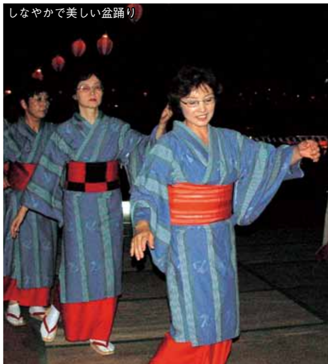
しなやかで美しい盆踊り

なお、花火募金として、245,978円をいただきました。来年の花火に使わせていただきます。ご協力ありがとうございました。