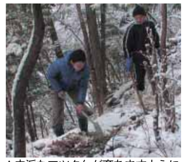
▲立派なマツタケが育ちますように

これは、地元集落の皆さんが「子どもや孫たちのためにも、マツタケが採れるような山をよみがえらせよう」とマツタケ山の再生を目指して発案した取り組みです。この日は、雪が降り積もる中、地元住民や神戸大学の学生約40人が松食い虫の被害に強い赤松の苗木「ひょうご元気松」約500本を丁寧に植樹しました。