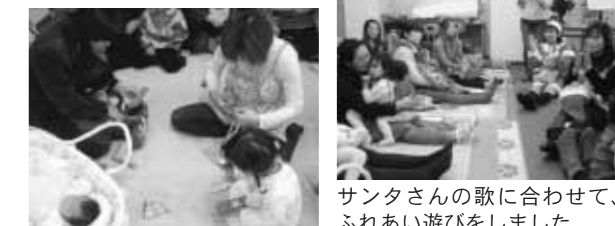
サンタさんの歌に合わせて、ふれあい遊びをしました。クリスマスツリーも作りました。