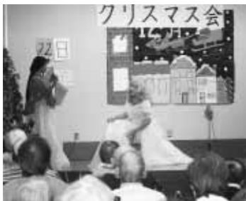
▲12月に開催したクリスマス会 (職員有志による劇の様子)

開催し、日々の生活を楽しむ工夫をしています。リハビリテーションを行うことで、介護職員などと連携し、自ら動くこととする意欲を引き出せるように、個別的集団的にリハビリを実施しています。