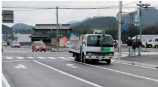
▲開通後は、国道427号から丹波方面へのアクセスが便利になります(高岸交差点)

1月6日、中町東線・中町西線の約1.5kmが開通しました。両路線は、中都市計画道路として平成13年度から整備され、今回、中町東線牧野交差点から700m、中町西線高岸交差点から300mが通行できるようになりました。両路線ともに片側1車線で、両側には歩道が整備されています。