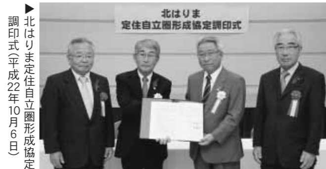
▶北はりま定住自立圏形成協定調印式(平成22年10月6日)

ビジョン(案)の閲覧および意見提出様式の配布場所 ・経営企画課 ・町ホームページ http://www.takacho.jp/ teijyujitsu/ その他 ・電話など口頭での意見はお受けできません。 ・提出された意見に対する個別回答はできません。 ・意見の反映結果・考え方については、提出意見とともに、後日町ホームページで公表します。