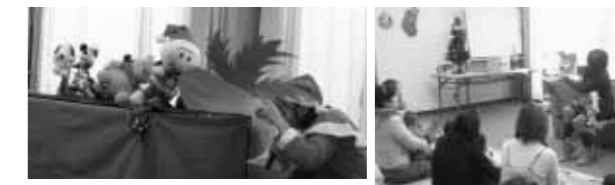
アンパンマンとその仲間たちの「おおきなかぶ」のおはなしは、子どもたちに大好評でした!

絵本サークル(おはなしかあさん)による『クリスマスおはなし会』が多可町図書館で行われました。子どもだけでなく大人にも絵本を楽しんでもらいたいと、趣向を凝らしたおはなし会となりました。