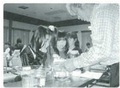
「ホタルの幼虫や、ホタルのえさになるカワナナの観察をしたよ。」