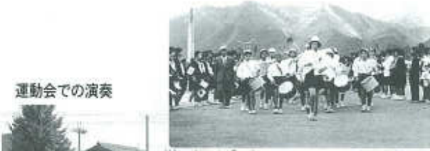
運動会での演奏 昭和37年頃の鼓笛隊

先輩から後輩に、長年にわたり受け継がれてきた中町北小学校伝統の鼓笛。これからも、地域の方々に愛され、鼓笛活動を通して地域の防火・防災に貢献できるように努めていきたいと思っています。