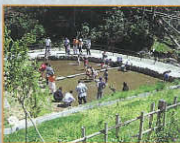
ジャブジャブ池でのアマゴつかみ

「知っ得TakaTown」では、多可町子どもたちに対しての、地域の耳寄り情報やおもしろいスポットを紹介していきます。