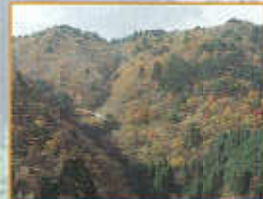
笠形山の紅葉もきれいですよ