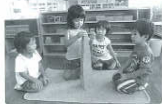
モンテッソーリ教具

個人活動の時間を重んじ、自分のペースで興味関心のある活動に満足できるまで、取り組むことが出来ます。活動に応じて行う年齢別の保育では、同じ目的に向かつて協力すること、社会生活に必要な習慣や態度を身につけて欲しいと