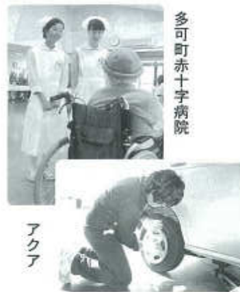
多可町赤十字病院 アクア

「トライやる・ウィーク」で学んだこと 今年、「トライやる・ウィーク」がはじまって13年目。中学2年生がいろいろな事業所で職場体験などを通して地域について学び「生きる力」を育むことを目的としています。 本校では2年生64名が5月31日から6月4日を中心に多可町と西脇市の26事業所でお世話になり、活動を通して多くのことを学びました。 「トライやる・ウィーク」で学んだこと(将来へ向けて生かしたいこと)と生徒のアンケート結果を紹介します。 学んだこと ○「礼」は相手を気持ちよくさせる ○伝えたいことをはっきり言う大切さ ○何度も繰り返し練習をして準備しておくことの大切さ 5日間のトライやるでいろんなことを学びました。仕事は大変だけれど多くの人と接する中で人の役に立っているんだなと思いました。訪問販売は大変でした。でも何度も練習したかいあって「〇〇軒を達成できました」ともよい経験ができました。 活動先 スマイルハンコ