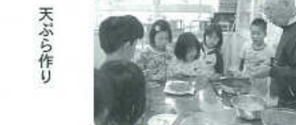
野草の採取 てんぷら作り