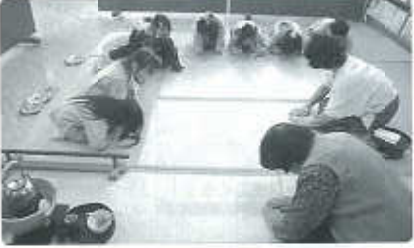
「よろしくおねがいします」

中町幼稚園では平成13年度から地域のけやき茶道クラブの方々にお世話になって毎週木曜日に「お茶教室」を開いてもらっています。 今年度も5月からお茶教室が始まりました。1回目は学級毎に全員が体験します。ほとんどの子がお茶を頂くことは初めてです。まず畳に上がる前に自分の脱いだ上靴を揃えて置きます。畳の上で正座をして待っている内に、中には足がしびれてしまう子もいますが、先生がお茶を点ててくださる様子をじっと真剣な目で見つめています。 お菓子やお茶が出されると、「お先です」「どうぞ」と挨拶を交わし、「いただきます」と畳に手をつけておじぎをします。