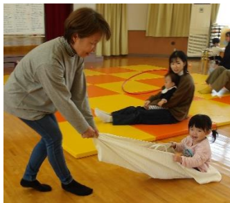
子どもにバスタオルを握らせませす曲がる時にバランス感覚が必要