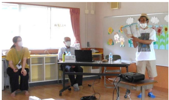
講師：地域共生推進協議会

地域共生推進協議会の皆さんに、防災について教えていただきました。学習会終了後には、センター利用者の方にも参加していただき、避難訓練も実施しました。