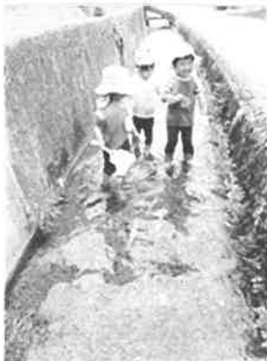
川の中も ジャブジャブ♪

赤土の泥んこのほうは、怖いのか近寄りもしなかったけど、砂場では水を流したのがおもしろかったのか、手でさわったり、足をつけたりして遊んでいた。花を摘んで水に浮かべたり、バケツやコップに入れておままごとをしたりしているようだった。にこにこ教室はとても楽しみみたいで、撮った写真を見せると、とてもうれしそうにおしゃべりしてくれる。