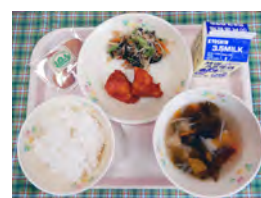
参考：令和3年9月8日実施 「多可町っ子いきいき献立」

特別メニューの「多可町っ子いきいき献立」は、給食費に町予算を上乗せして、年2回程度実施しています。より多くの地元食材を使用し、“おいしい給食”として子どもたちに好評を得ています。