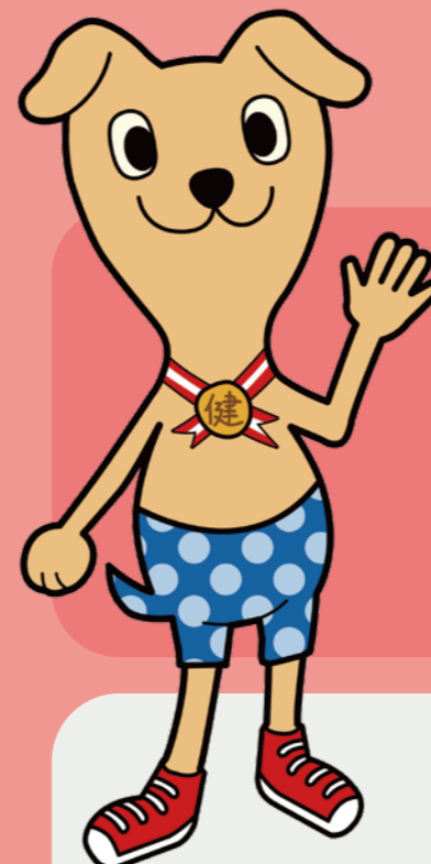
多可町健康づくりキャラクター ケン助くん