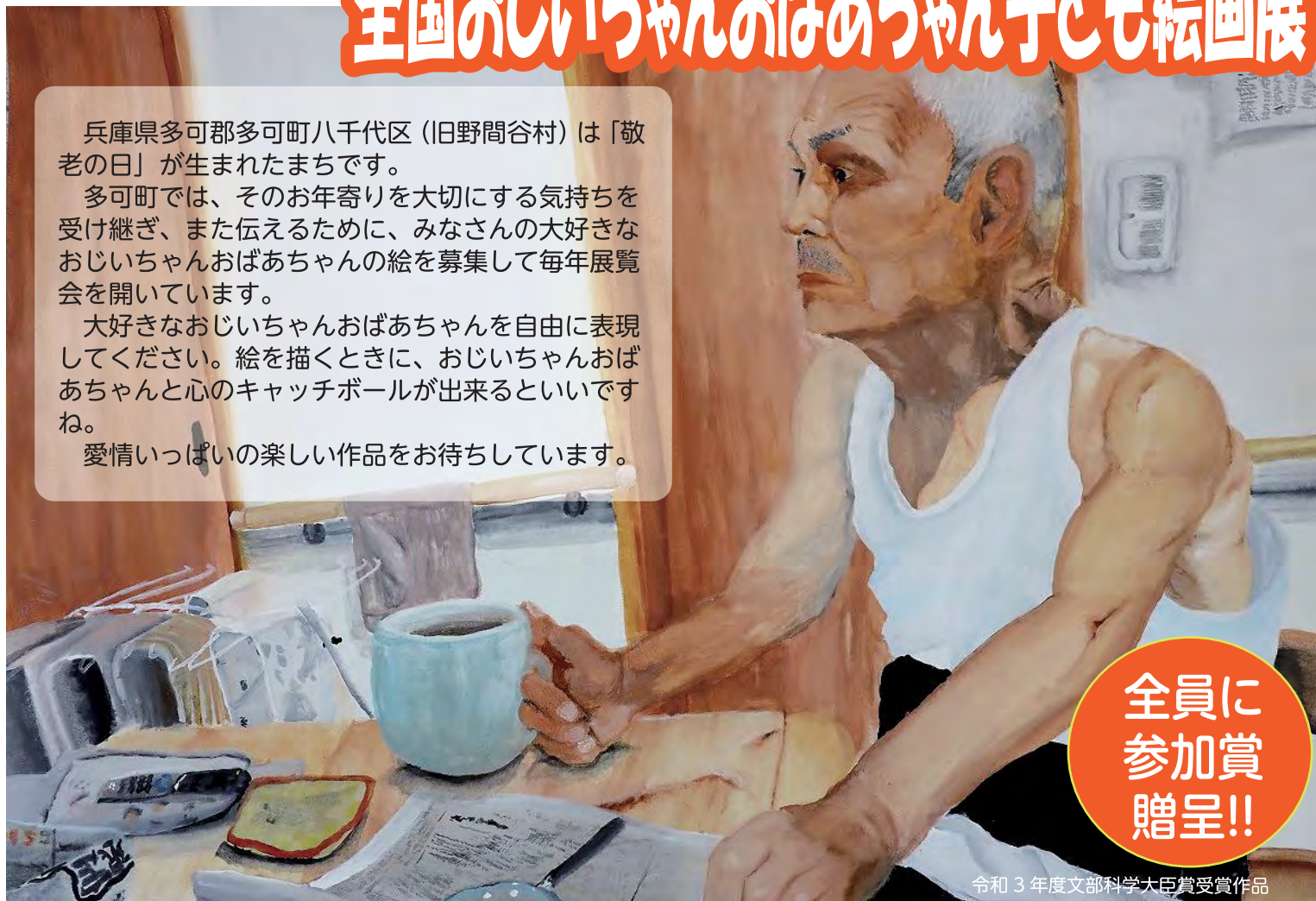
令和3年度文部科学大臣賞受賞作品