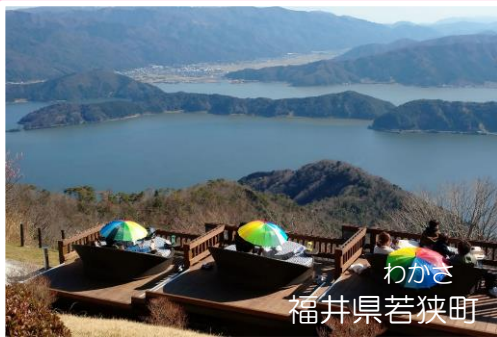
わかさ 福井県若狭町