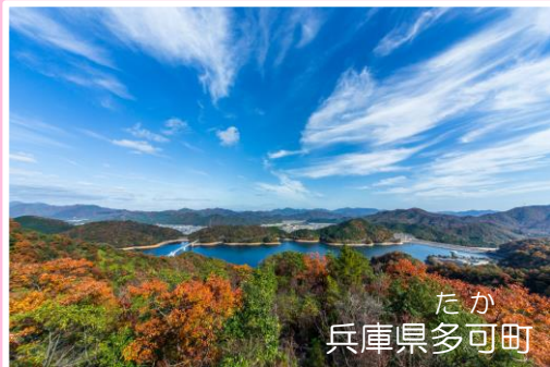
たか 兵庫県多可町