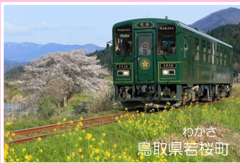
わかさ 鳥取県若桜町