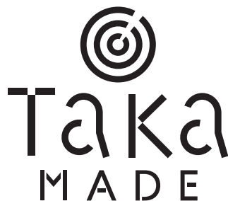
【ロゴの左右1:マークの左右0.35】