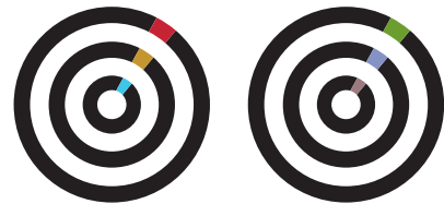
【シンボルマークの展開デザイン】