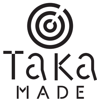
【ロゴの左右1:マークの左右0.5】