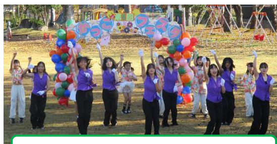
「Color's」によるオープニングダンス