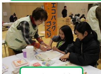
エコバックづくり