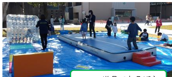
エア―遊具であそぼう