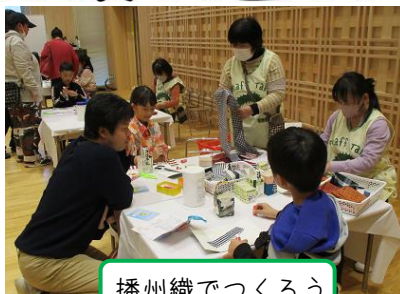
播州織でつくろう