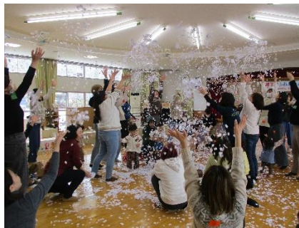
大人も童心にもどる紙吹雪。とってもきれいでした。