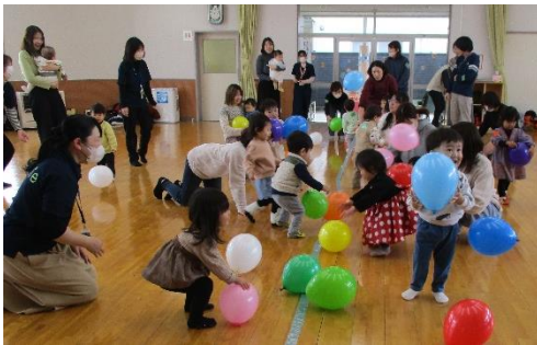
風船あっちいけゲーム

オープニングは「おとはな」による手遊び、ペープサート「はたらくくるま」、人形劇「おおきなかぶ」で盛り上がりました。