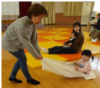
子どもにバスタオルを握らせませす曲がるときにバランス感覚が必要